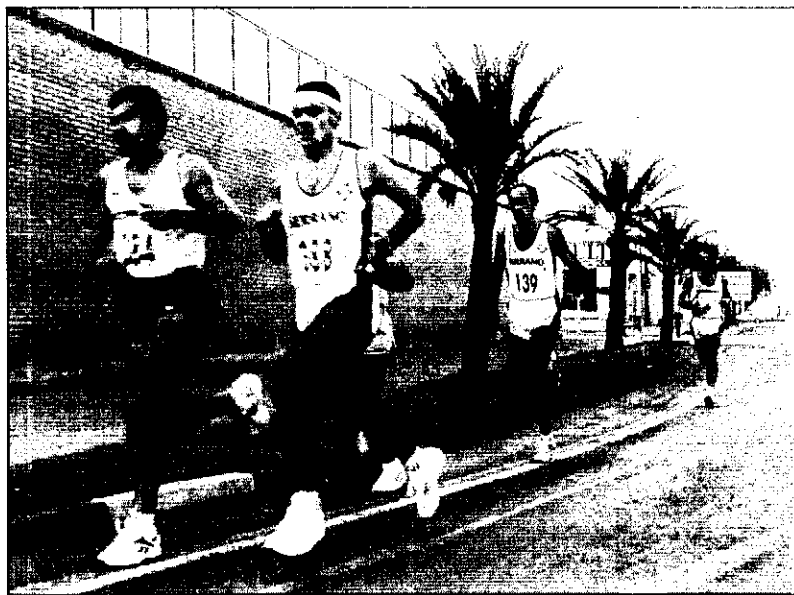
Participants en la prova.