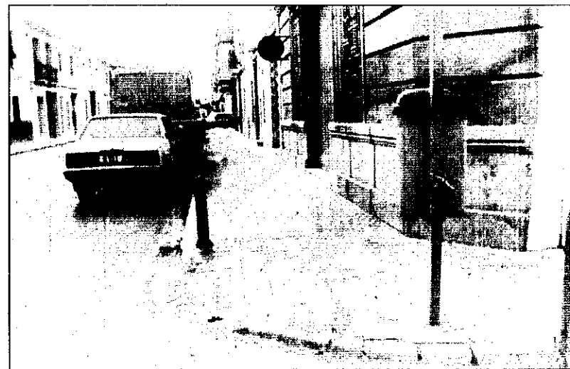
La supresión de las barreras se está realizando por todo el municipio.

La campaña la desempeñarán los escolares de Picanya quienes asumirán la misión de colocar carteles con la leyenda "No crees más barreras", en los