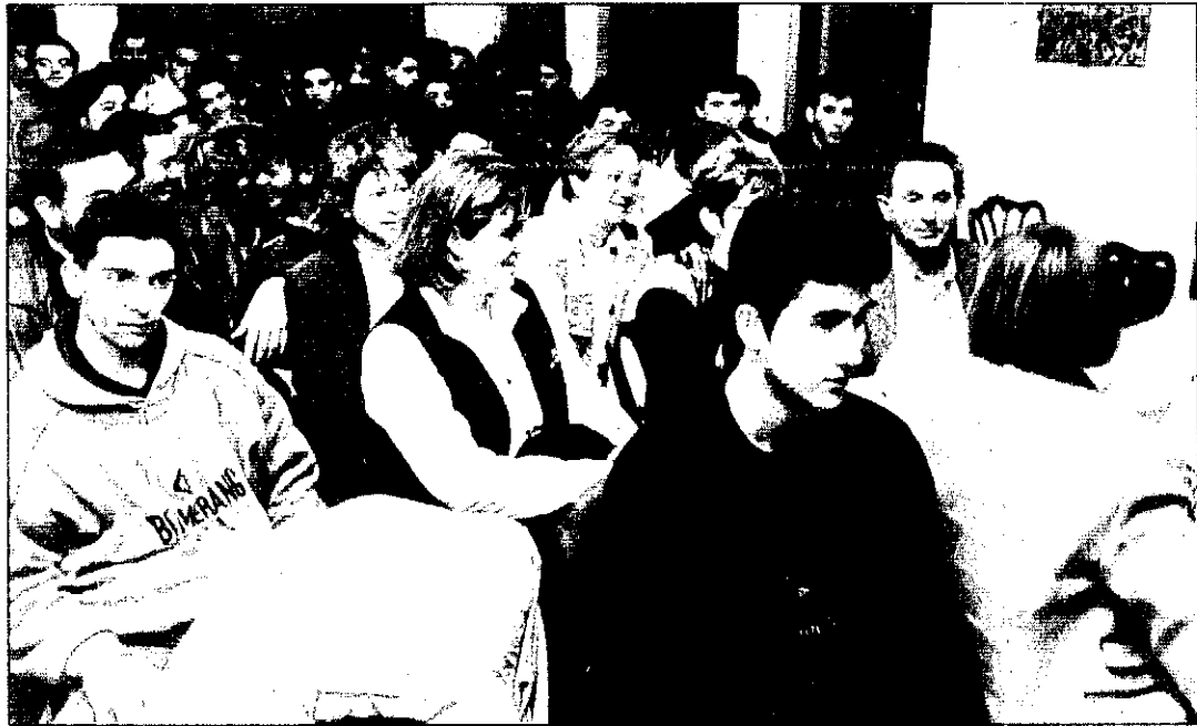
Assistents a l'acte de presentació de l'escola taller.

PERIÒDIC LOCAL DE PICANYA - II ÈPOCA - ANY III - NÚM. 19 - GENER-FEBRER 1995