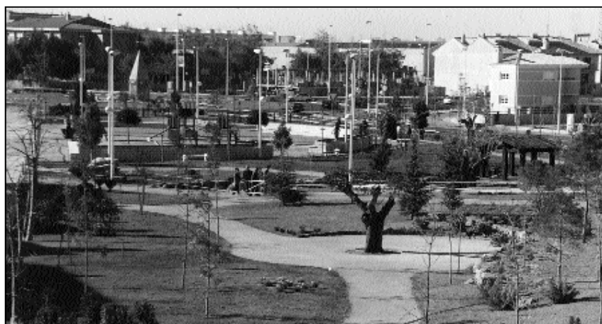
Una nueva zona de ocio para compartir entre todos y todas pero sobre todo...

Hay que recordar que Picanya dispone en estos momentos de 32,5 m 2 de zona verde por habitante. En sus calles y plazas se han plantado 18.548 árboles, es decir, existen dos árboles por cada habitante. Estas cifras hacen de Picanya el municipio de L'Horta Sud con más zona verde por habitante.