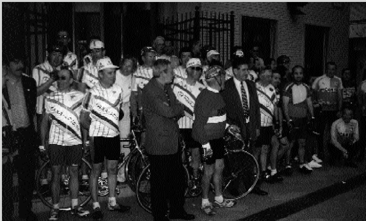
Ciclistes de Panazol arriben a Picanya acompanyats per alguns dels nostres

El passat mes de Març, coincidint amb la celebració de les falles, van visitar el nostre poble un grup de veïns de Panazol. Aquest va ser un viatge molt especial pel fet de que els visitants van realitzar tot el recorregut en bicicleta.