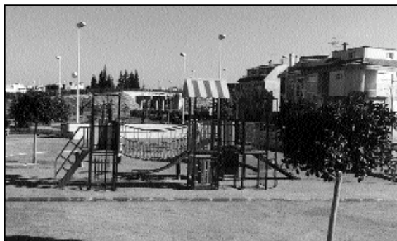
... un parque para nuestros ciudadanos y ciudadanas más jóvenes.