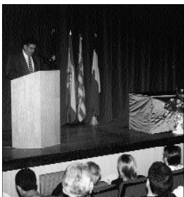
Acte de celebració del 56 aniversari de l'agermanament el passat mes de març

L'eixida del viatge està prevista per al dia 24 de juny i la tornada per al 29. El preu per a tots aquells i aquelles que esteu interessats serà de 10.000 pts. i la inscripció ja està oberta al Centre d'Informació de l'Ajuntament (de 9.00 a 21.00 h. de dilluns a dissabte) fins al 15 de juny.