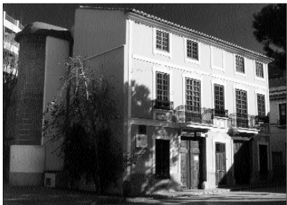
Centre de Salut a la Plaça Major