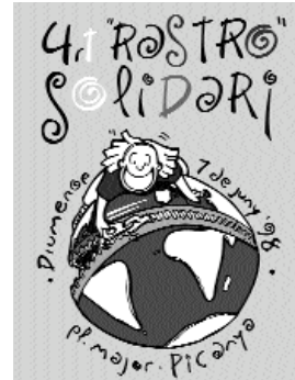
Cartell Rastro Solidari 1998

Es tracta d'una activitat de sensibilització de cara a la problemàtica dels països en via de desenvolupament, en aquest cas l'activitat més forta que organitza el Consell per la Solidaritat i Voluntariat Social de Picanya, ja que la seua activitat està vigent al llarg de tot l'any.