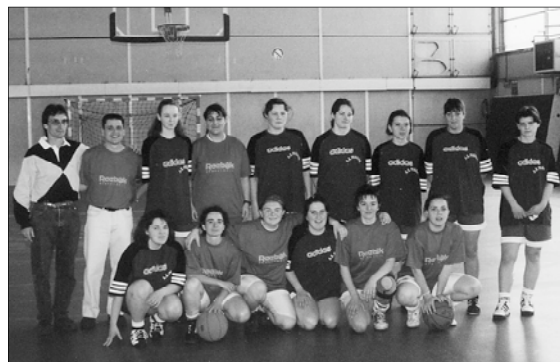
Els equips de bàsquet femení de Panazol i Picanya compartiren la seua afició per aquest esport.

No era la primera volta que els i les esportistes picanyers eixien a visitar Panazol i l'acollida, com sempre, va ser excel·lent. Tots i totes tornaren amb un bon record de la seua