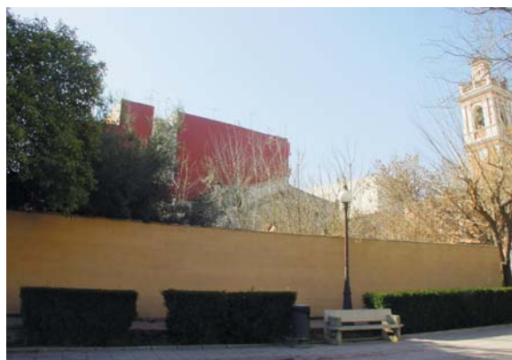
Solar destinat a la construcció del Centre de Salut

El termini per a la presentació d'ofertes ha finalitzat el mes de gener. Una vegada que la Conselleria d'Infraestructures i Transports adjudique l'obra, l'empresa guanyadora del concurs tindrà un termini de quatre mesos per a la execució de les obres.