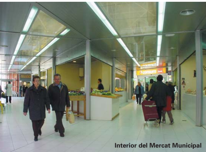
Interior del Mercat Municipal

El Premi Nacional de Comerç Interior que s'atorga als ajuntaments valora principalment les actuacions sobre l'urbanisme de la localitat que milloren i faciliten el desenvolupament del comerç local.