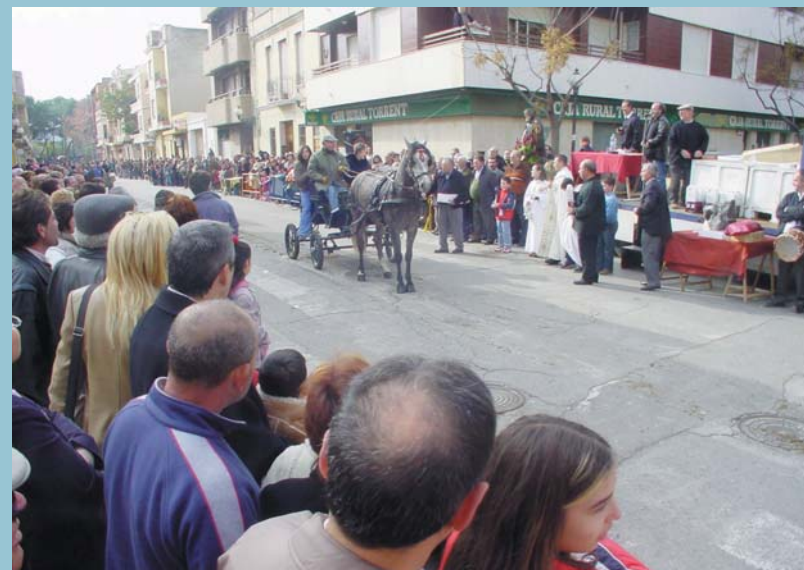
Carrer ample durant la desfilada dels animals

beneficiàries es pot consultar al Centre d'Informació i Gestió (CIG) de l'Ajuntament de Picanya així com a l'espai web municipal: www.ajuntament.picanya.org