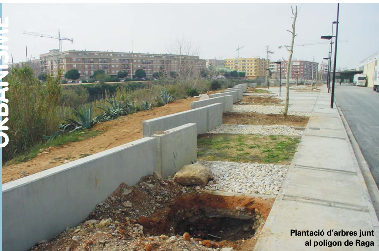
Plantació d'arbres junt al polígon de Raga