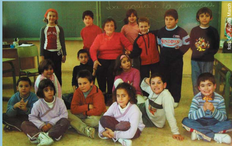
La classe durant la visita

Amb aquest programa s'ha aconseguit formar futurs vianants i conductores i conductors més conscienciats amb els riscos que implica no respectar el codi de la circulació. A més a més, també s'ha aconseguit la implicació de les famílies i les autoritats en la formació d'uns futurs conductors i conductores més responsables i respectuosos.