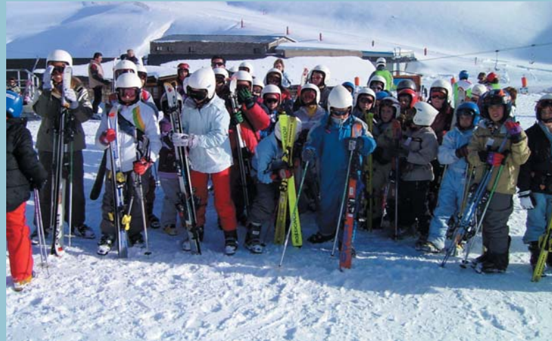
El grup a l'estació de Boi-Taüll

Des del 13 de febrer obri al públic l'oficina d'informació de la Piscina Coberta. D'aquesta manera totes les persones interessades a conèixer com serà el funcionament i l'oferta d'activitats de la instal·lació (piscina de 25x12,5 m, hidroteràpia, iniciació, relaxació, bany de vapor, sauna, dutxes escoceses, fitness...) podran obtenir tots els detalls a l'oficina instal·lada a les dependències de la mateixa piscina.