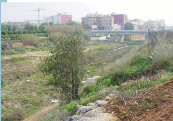
Sobre aquesta zona es construirà la passarel·la

La vista des de l'altra part del barranc d'aquesta zona verda serà com la d'una zona boscosa que cobrirà bona part de la cara sud del Polígon Industrial de Raga i millorarà l'aspecte del conjunt.