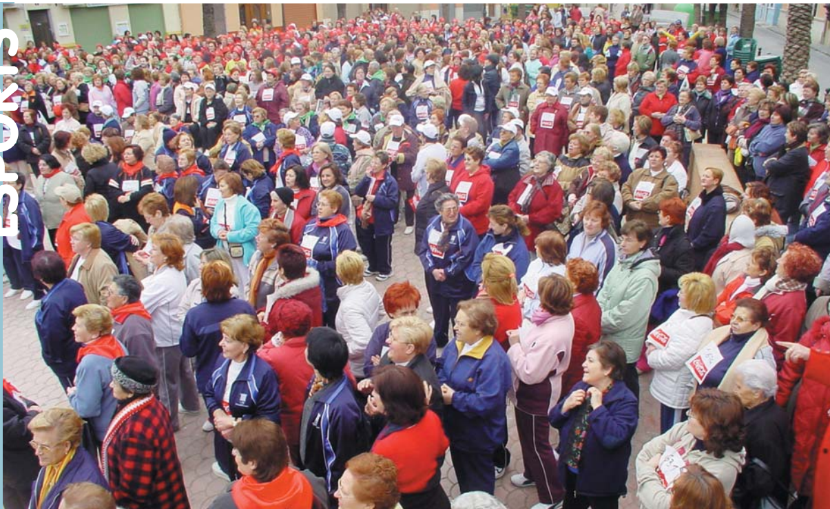
Concentració a la Pl. País Valencià