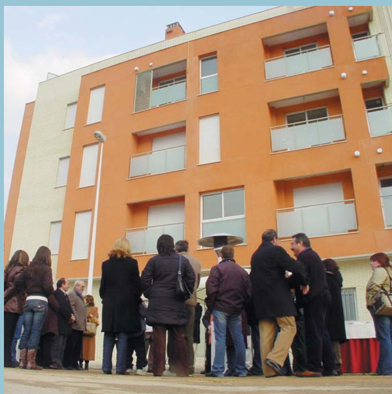
Acte de lliurament dels habitatges a peu de l'edifici

La Conselleria de Sanitat ha adjudicat mitjançant concurs públic la redacció i l'estudi del projecte per al centre de salut de Picanya. Aquest projecte es troba en la seua fase inicial, ja que el que acaba d'aprovar-se és la realització dels estudis previs. Una vegada estiga redactat aquest projecte, la conselleria haurà de tornar a fer un altre concurs públic per tal d'adjudicar l'execució final de les obres, raó per la qual encara resulta difícil preveure una data d'inici de les obres, tot i que l'Ajuntament fa anys que va posar a disposició de la Conselleria els terrenys per a la construcció del nou centre.