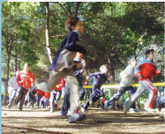
Un moment de la prova

paració dels berenars que reben les participants quan arriben al Poliesportiu i en les activitats lúdiques que allí se celebren.