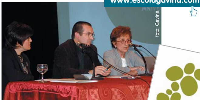
Imatges dels actes de celebració i del cartell anunciador del XXX aniversari