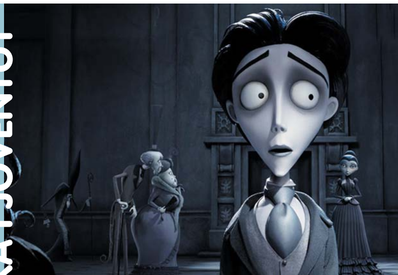
Imatge de La núvia cadàver