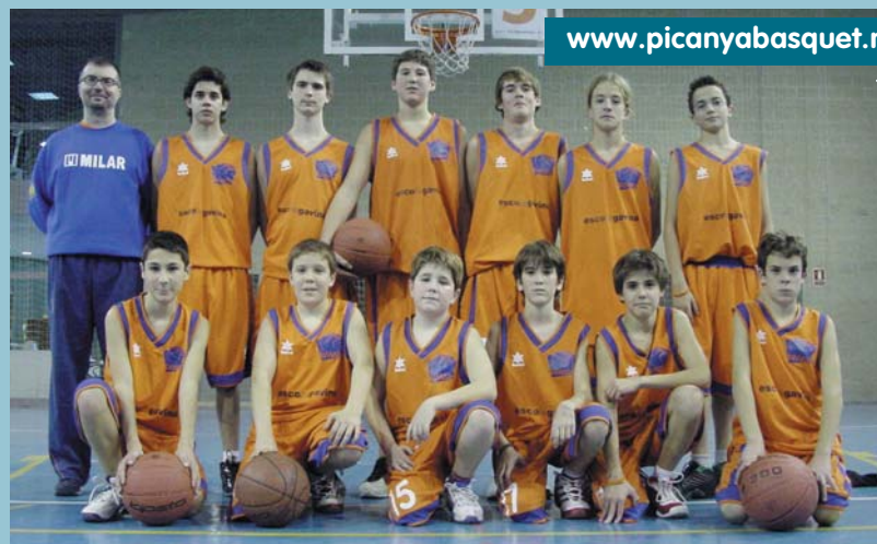
Equip Infantil Masculí del Picanya Bàsquet