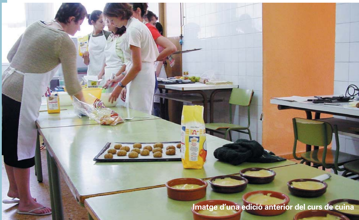
Imatge d'una edició anterior del curs de cuina

El passat 15 de gener els carrers del nostre poble tornaren a pler-se de carros, de cavalls, de rucs... per tal de celebrar la festa de la benedicció dels animals en honor a Sant Antoni. Una vegada més centenars de picanyers i picanyeres s'acostaren fins al carrer ample per tal de gaudir del bonic espectacle d'aquests animals en totes les seues varietats: cavalls grans, menuts, de treball, de passeig... i poder dedicar així un aplaudiment als homes i a les dones que amb el seu esforç i dedicació mantenen viva aquesta part de la nostra memòria que encara ens recorda que, almenys en una època, vam viure apegats a la terra.