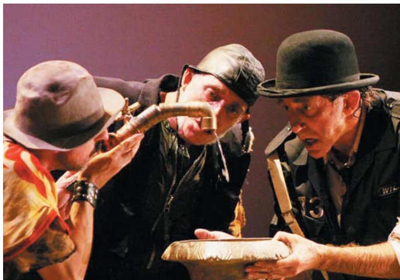
Vol-Ras ens porta Mondomono

Finalment, el diumenge dia 2 d'abril, es projectarà Reinas , pel·lícula que mostra les darreres hores de la preparació de la boda col·lectiva de cinc gais. Les seues mares, totes a l'hora, seran les encarregades de preparar, en primera persona, la cerimònia i de posar els seus fills a punt d'acabar al psiquiàtric.