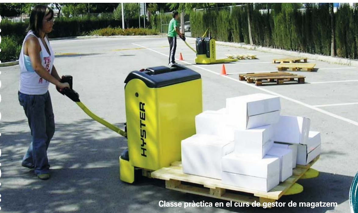
Classe pràctica en el curs de gestor de magatzem