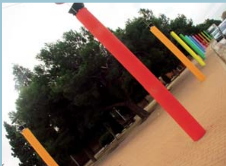
Jardí a la porta del cementeri