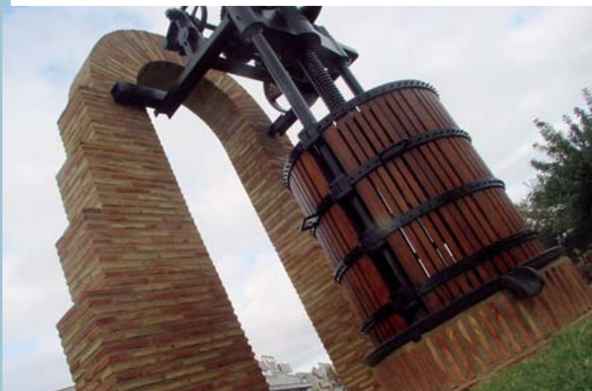
L'almàssera llúix com nova després de la restauració

Aquests treballs han estat realitzats per personal contractat per l'Ajuntament en col·laboració amb el Servef. Aquests convenis permeten la inserció laboral de persones o de col·lectius desfavorits i, en aquesta ocasió, han servit per a millorar l'aspecte de dues zones de passeig i d'esplai del poble.