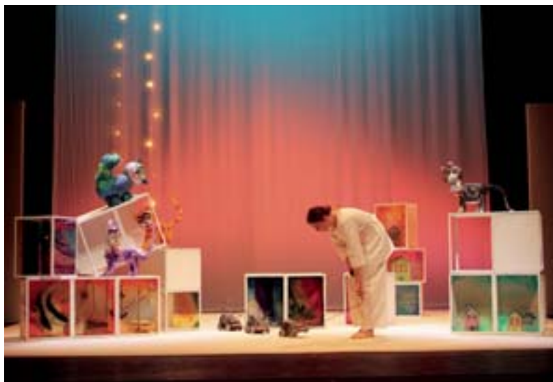
TDJ Produccions ens porta Zorbas i la gavina afortunada