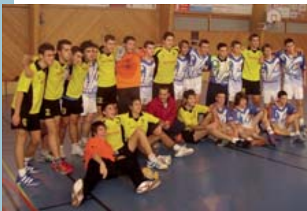
Equips d'handbol de Panazol i Picanya

Una vegada més la resposta dels atletes ha estat excepcional i tot i la coincidència en el calendari amb altres proves més de 2.500 atletes (1.600 per a la Mitja i 900 per a la Quarta) van prendre l'eixida en aquesta 14a edició. D'aquesta manera la prova de Picanya i Paiporta es manté com una de les de major participació a nivell del nostre País sols superada per autèntics mites de la cursa a peu com ara la marató de València o la maratonina.