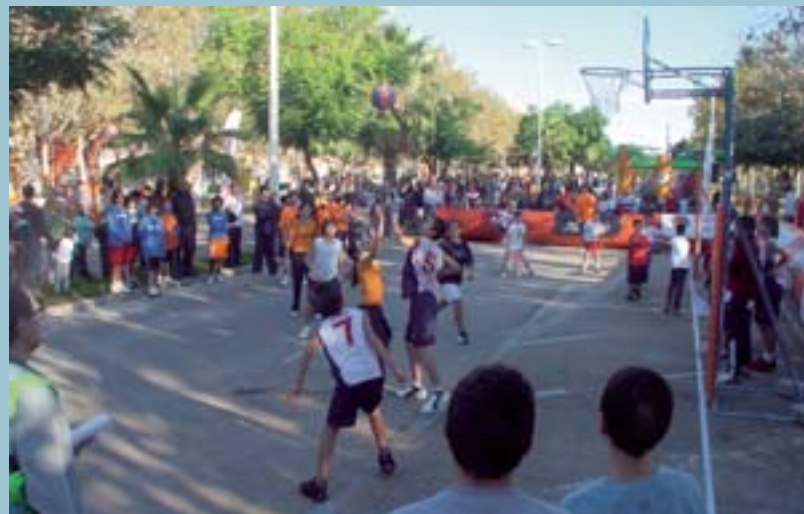
Bàsquet al carrer

La filosofia d'aquests encontres és la mateixa que inspira les activitats de les Escoles Esportives Municipals, és a dir, introduir els xiquets i xiquetes a la pràctica esportiva, com a mitjà de socialització i de millora de la condició física. Les escoles esportives no seleccionen els millors, ja que parteixen de la base que qualsevol xiquet o xiqueta és apte per a practicar l'esport. Aquesta filosofia no competitiva fa que els encontres d'escoles esportives siguin una autèntica festa de l'esport.