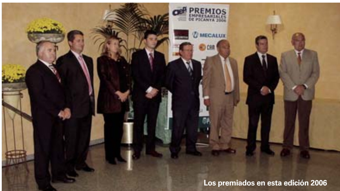
Los premiados en esta edición 2006