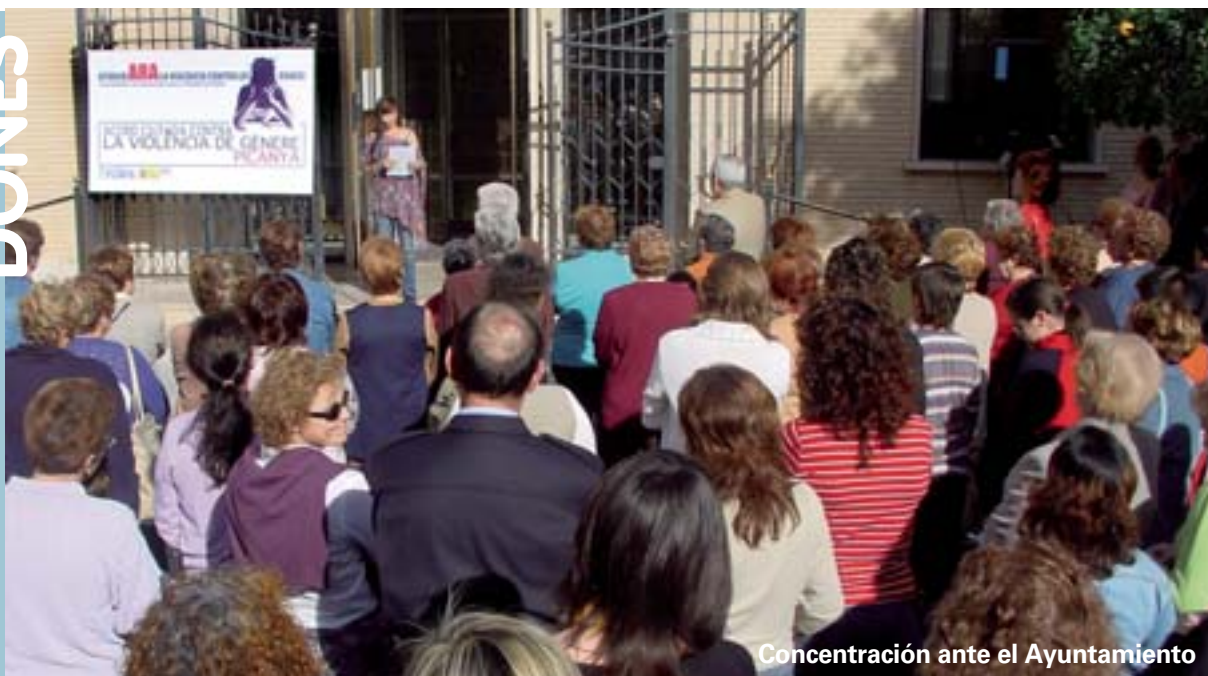
Concentración ante el Ayuntamiento