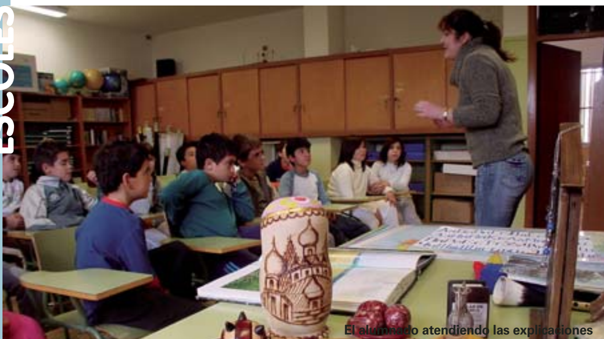
El alumnado atendiendo las explicaciones

Y finalmente el pasado viernes 24 de noviembre más de 300 personas se concentraron ante el Ayuntamiento para la lectura de manifiesto y guardar cinco minutos de silencio en solidaridad con las víctimas que, lamentablemente, podrán sumar la escalofriante cifra de 100 mujeres muertas para finales de año.