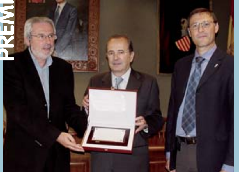
Moment de lliurament de la placa commemorativa