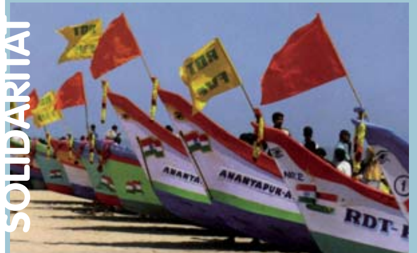
La solidaritat picanyera va permetre la fabricació d'aquestes barques amb les quals els pescadors indis poden guanyar-se la vida dignament

Picanya se situa així al costat d'altres ciutats com ara Bilbao, Vitòria, Sabadell o Santa Cruz de Tenerife que ja formen part de la selecta nòmina de poblacions guanyadores.