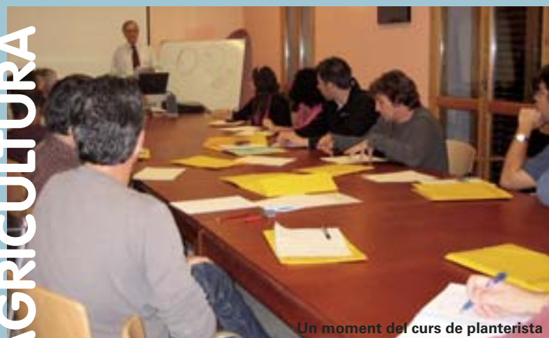
Un moment del curs de planterista

Finalmente el premio a la CALIDAD DEL COMERCIO TRADICIONAL, para destacar a aquellos comercios que realizan esfuerzos de calidad tanto en la atención al público como en el producto y reconocer la labor de los titulares de actividades minoristas, tan tradicionales en la trama urbana y en los hábitos de compra de los ciudadanos de nuestro municipio fue para el conocido establecimiento CHARCUTERIA PEPE.