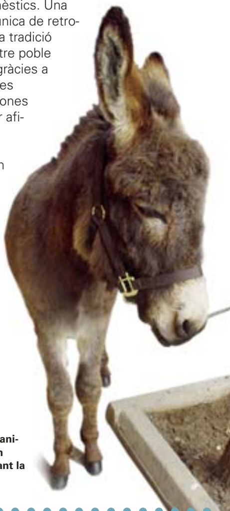
Un dels bonics animals que poden admirar-se durant la benedicció

Com cada any el proper 14 de gener se celebra a Picanya la tradicional benedicció d'animals de la festivitat de Sant Antoni. La benedicció se celebrarà al carrer Colón i, com en anys passats, s'hi espera l'arribada de moltes persones amb els seus animals domèstics. Una oportunitat única de retrobar-se amb la tradició rural del nostre poble encara viva gràcies a l'esforç d'unes poques persones que, sols per afició, encara mantenen animals, com ara cavalls i rucs en un esforç digno d'admiraació.