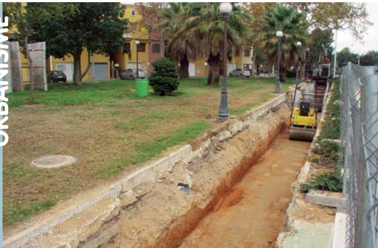
Obres de construcció del col·lector