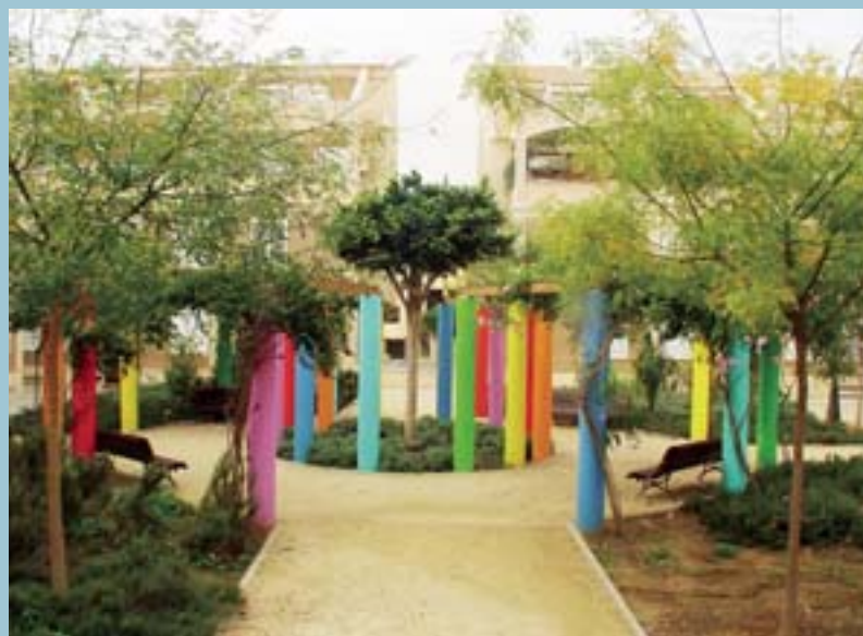
Plaça de la Concòrdia

Amb la instal·lació d'aquest nou col·lector se solucionarà l'actual problema de retorn d'aigües a aquesta zona. A més a més, el col·lector del carrer Colón quedarà molt alleugerit de la seua càrrega actual, cosa que també millorarà el seu comportament davant pluges torrencials.