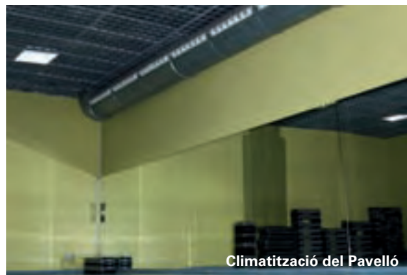
Climatització del Pavelló

finalitzades les obres, els dos frontons tindran l'equipament i les dimensions reglamentàries per a la pràctica d'aquest esport.