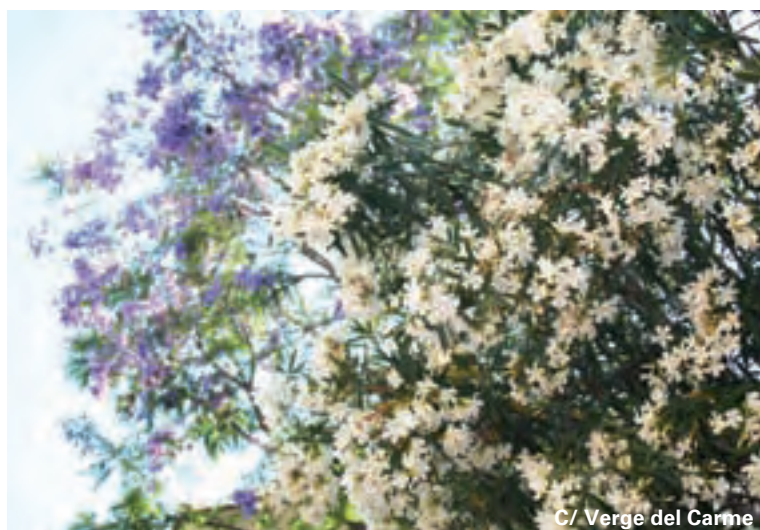
C/. Verges del Carme

La escuela infantil de cero a tres años, supone un paso muy firme en el camino de la corresponsabilidad social a la hora de la crianza de los hijos e hijas.