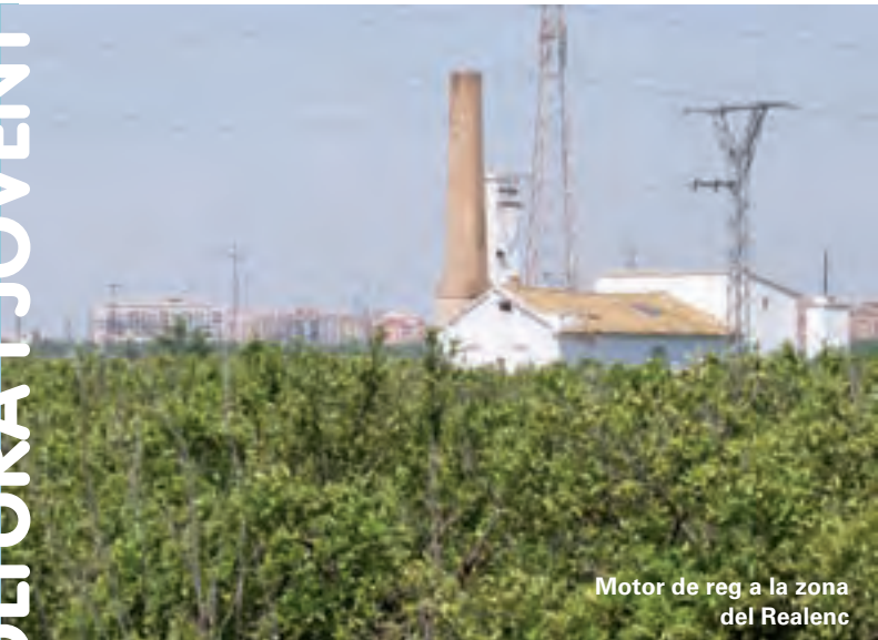
Motor de reg a la zona del Realenc