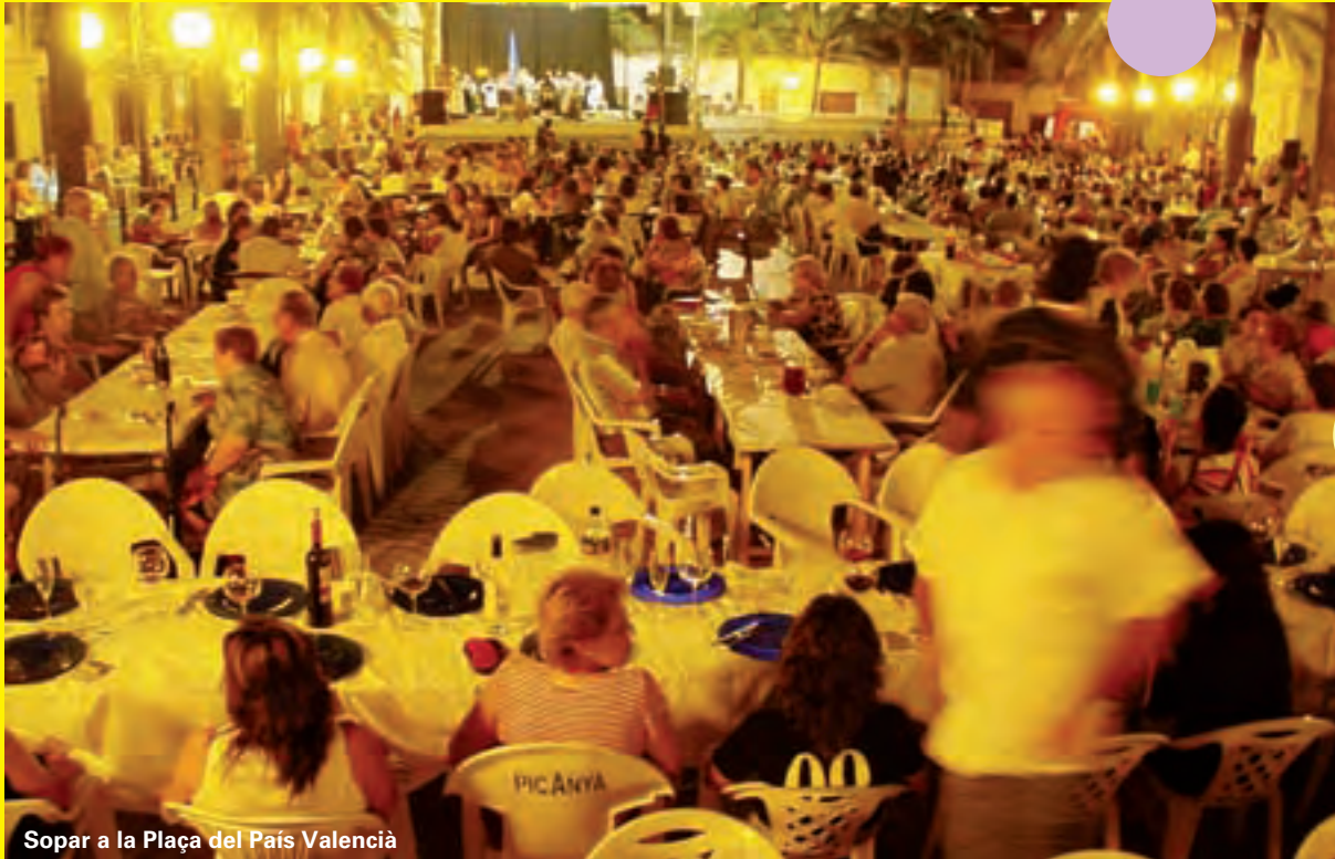
Sopar a la Plaça del País Valencià