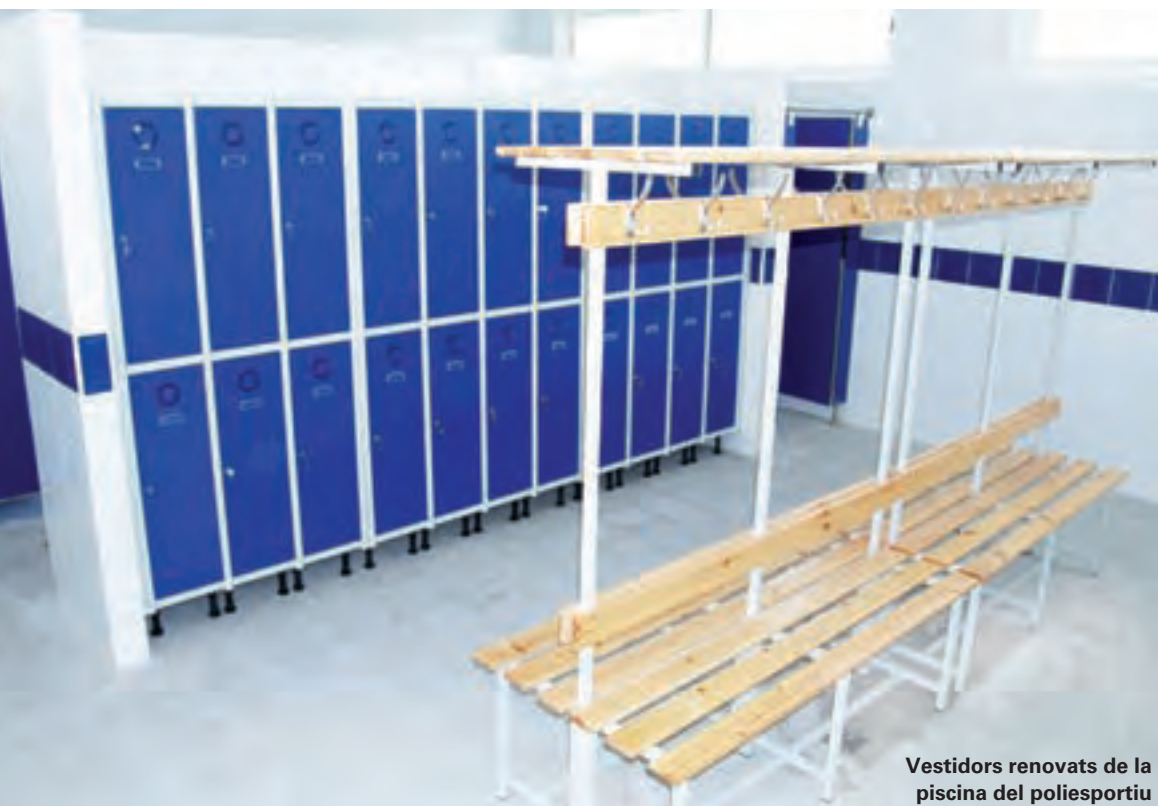
Vestidors renovats de la piscina del poliesportiu