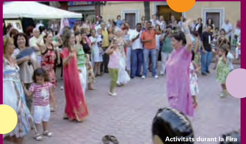
Activitats durant la Fira