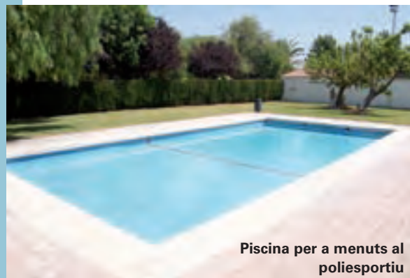
Piscina per a menuts al poliesportiu

És el cas de la remodelació total que s'ha fet dels vestidors de la Piscina del Poliesportiu de Picanya. Les anteriors instal·lacions eren antigues i havien quedat obsoletes. El que s'ha fet es derruir per complet tot l'interior dels vestuaris i s'han tornat a fer de nou, amb un disseny més actual i adequat per al seu ús i amb materials que faciliten la seua neteja i el seu manteniment. A més a més, la reconstrucció dels vestuaris ha contemplat també la substitució de les instal·lacions elèctriques i d'aigua, així com tots els sanitaris i dutxes.