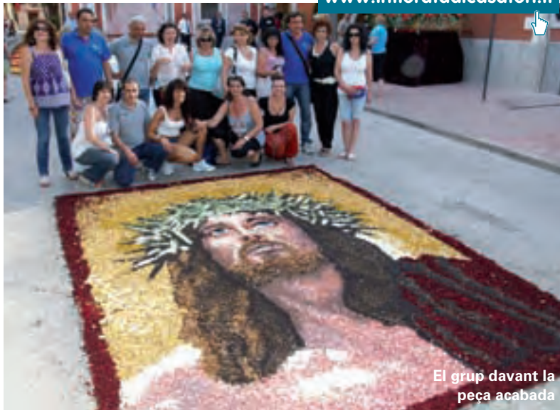
El grup davant la peça acabada