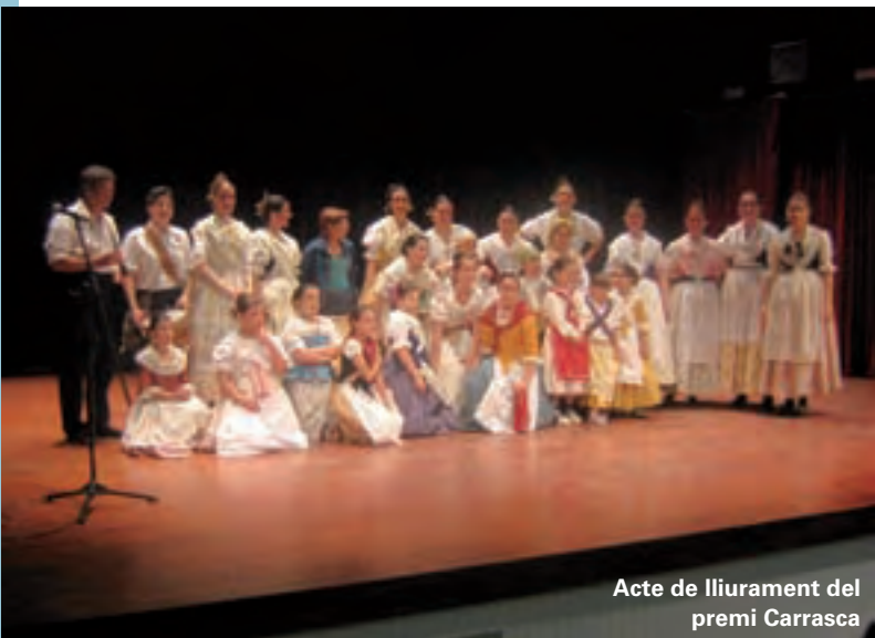
Acte de lliurament del premi Carrasca

A més a més, el Cor d'Adults va participar el passat 22 de maig a l'homenatge a l'himne de la Comunitat Valenciana que se va celebrar a València i on 2009 músics van commemorar el centenari de la Exposició Universal de 1909, per a la qual es va compondre l'himne.