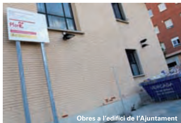
Obres a l'edifici de l'Ajuntament

A l'edifici de l'Ajuntament de Picanya s'estan realitzant també obres de millora i per a facilitar-ne l'accessibilitat. A la planta baixa s'ha remodelat per complet un quart de bany per tal que el puguin uti-