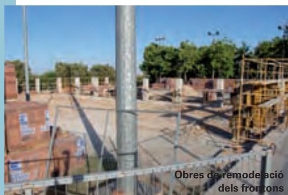
Obres de remodelació dels frontons

Una altra de les obres ja executades és la que ha millorat el sistema de depuració d'aigües a la piscina infantil del Poliesportiu. S'han instal·lat unes noves canalitzacions per tal de portar l'aigua fins a la depuradora. També s'ha ampliat la caseta de la depuradora, per tal d'allotjar els nous equipaments per a la impulsió d'aigua. En total, les obres executades a la Piscina Municipal han comptat amb un pressupost de prop de 90.000 euros.