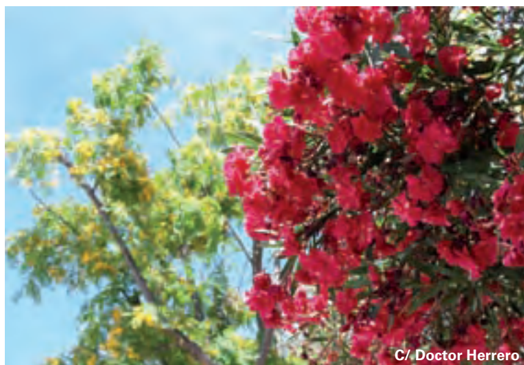
C/. Doctor Herrero