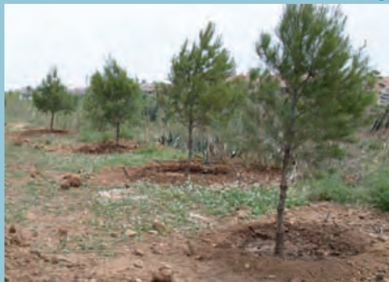
Replantació de pins a la vora del barranc