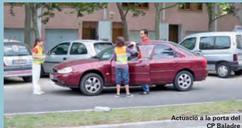
Actuació a la porta del CP Baladre