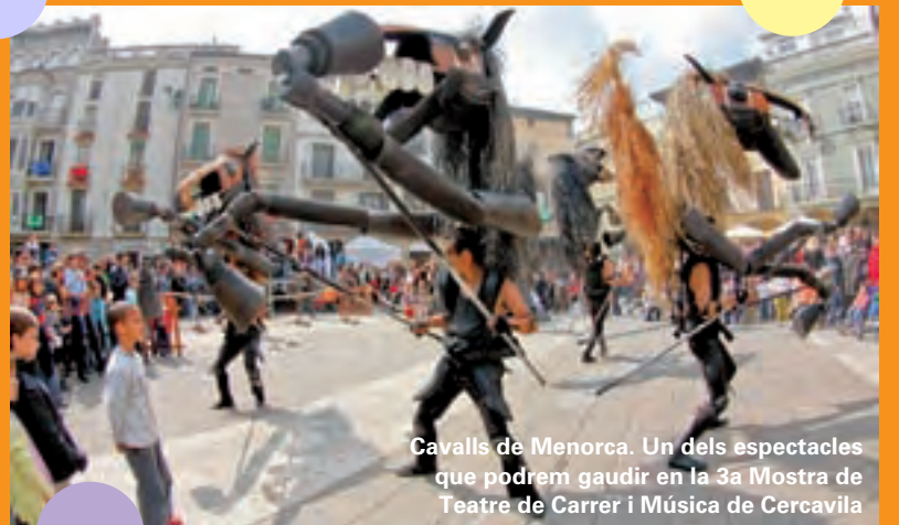
Cavalls de Menorca. Un dels espectacles que podrem gaudir en la 3a Mostra de Teatre de Carrer i Música de Cercavila

Degustacions, tallers per a menuts, educació vial, animació de carrer i fins i tot, una paella gegant per a més de 1.000 persones completaran un programa que durant dos intensos dies (27 i 28 de juny) ens permetrà descobrir el nostre variat i interesant comerç local.