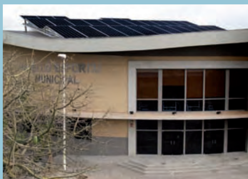
Simulació d'instal·lació de les plaques fotovoltaïques al sostre del pavelló

Un dels parcs en els que es realitzarà una intervenció més significativa és el Parc de les Albízie, allà es van a plantar una dotzena d'arbres d'espècies com ara el ficus, l'albícia el celtis o la ceratònia, que es caracteritzen per ser arbres que ofereixen una gran ombra. Una altra de les zones on més arbres es van a plantar és la pinada que hi ha junt al Barranc i que, va un temps, es va veure afectada per un incendi. En aquesta zona es van a plantar 40 exemplars de pins blancs que conformaran un xicotet bosc mediterrani.