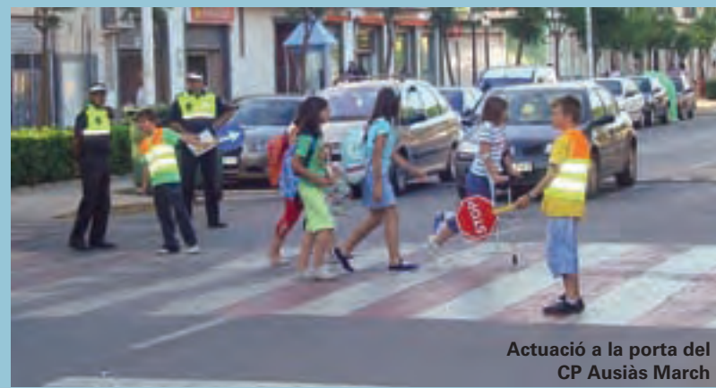
Actuació a la porta del CP Ausiàs March

A hores d'ara són ja centenars els xiquets i les xiquetes que han gaudit de jocs, excursions, cançons... en les diferents edicions de l'escola d'estiu que, sempre, ha volgut sumar al seu caire eminentment lúdic un toc cultural i educatiu amb temàtiques com ara, la música, la creació plàstica, el medi ambient... de tal manera que menuts i menudes, a més de diversió, han trobat també un projecte educador, potenciador de coneixement i que sempre ha volgut aportar eixe grau més que "saviesa" als nostres menuts i menudes.