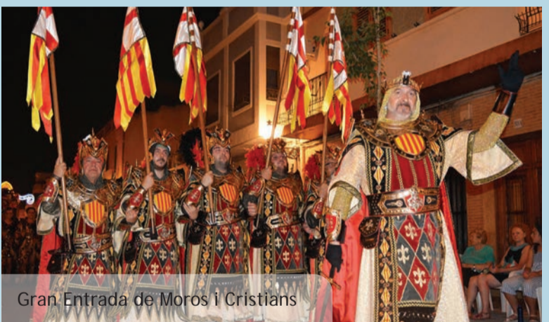
Gran Entrada de Moros i Cristians