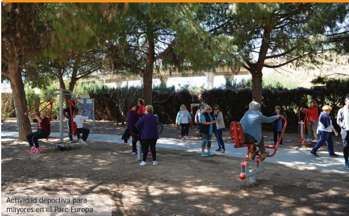
Actividad deportiva para mayores en el Parc Europa