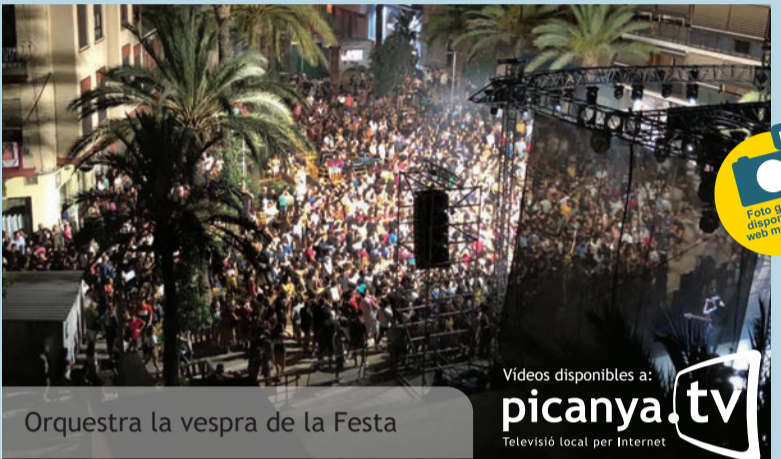
Orquestra la vespra de la Festa

E l 13 de juliol finalitzaven les Festes Majors de Picanya 2019. Una programació festiva que va incloure música, tradicions, folklore, ball, esports, teatre de carrer, sopars a la fresca... i que va oferir activitats per a totes les edats des de ben menuts i menudes a persones majors. En este 2019 les xifres de participació han fet bo l'eslogan de "Festes a plaça plena" i tots els actes han comptat amb una gran quantitat de públic amb moments com la vespra de la festa (primera foto) en els que la Plaça del País Valencià es va plenar per complet per a disfrutar de l'espectacle.