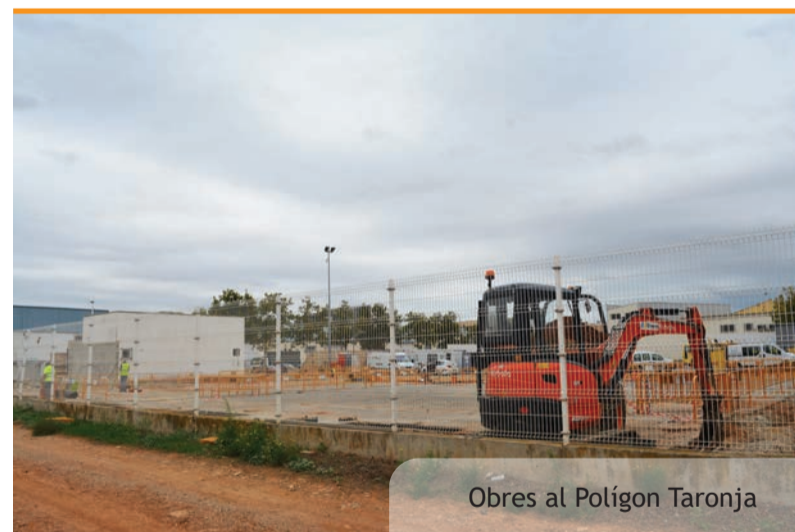
Obres al Polígon Taronja

L'horari d'obertura de l'Ecoparc Mòbil serà de 10.00 a 14.00 hores, i de 16.00 a 19.00 hores i dissabte de 10.00 a 13.00h.