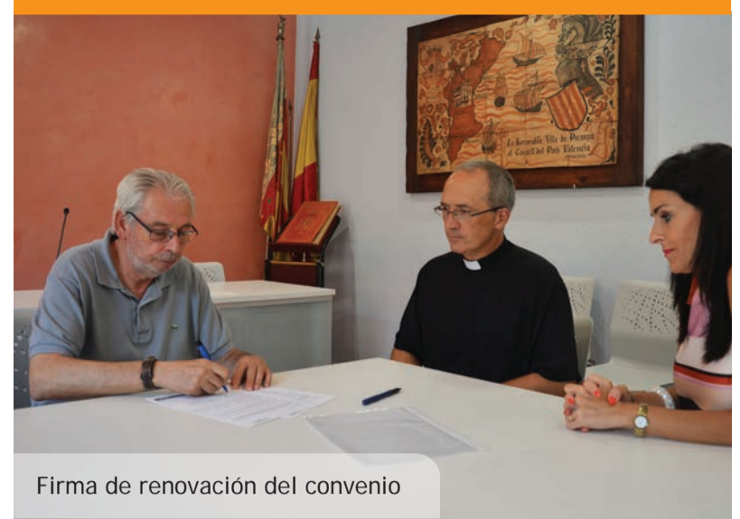
Firma de renovación del convenio