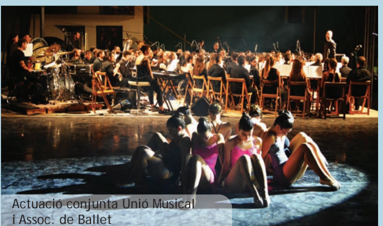
Actuació conjunta Unió Musical i Assoc. de Ballet