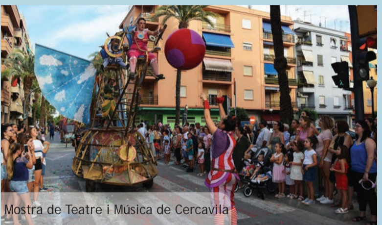
Mostra de Teatre i Música de Cercavila

Vídeos disponibles a: picanya.tv Televisió local per Internet