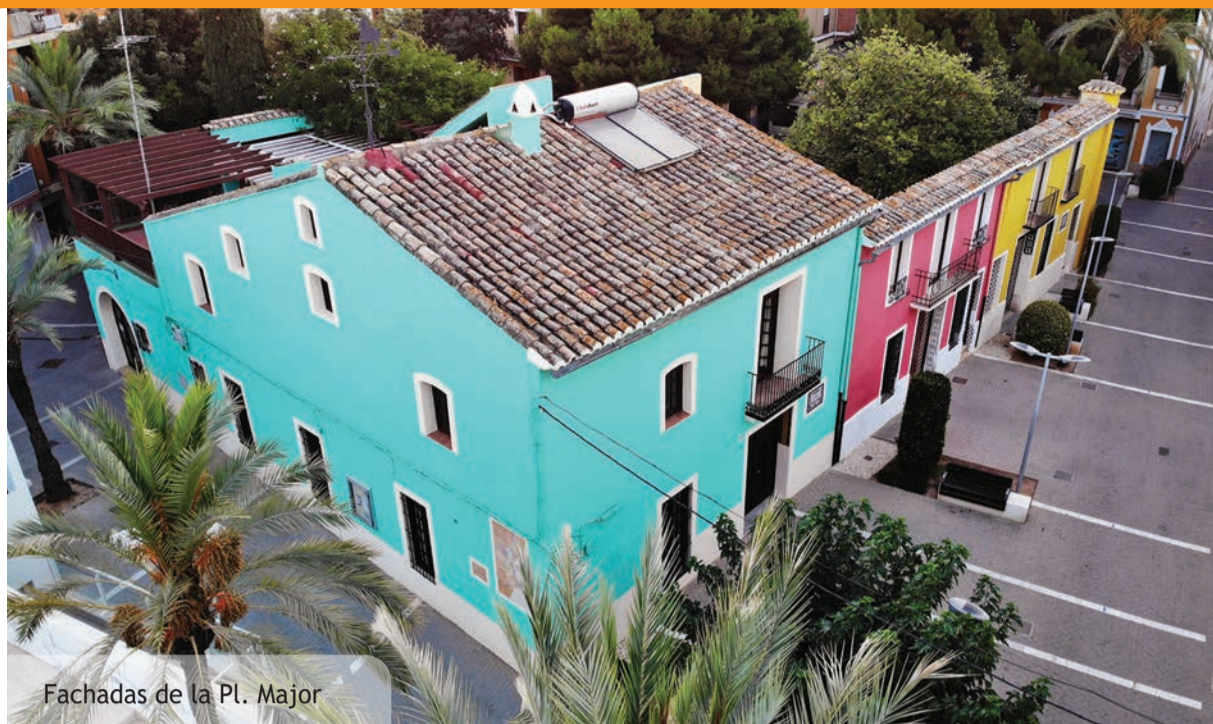
Fachadas de la Pl. Mayor