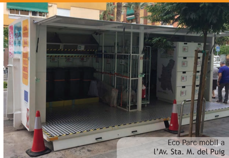
Eco Parc mòbil a l'Av. Sta. M. del Puig

El plazo de presentación de solicitudes fue de dos meses a partir de la publicación de la convocatoria en el BOPV el día 1 de julio. El Ayuntamiento tiene previsto volver a convocar estas ayudas de forma anual.