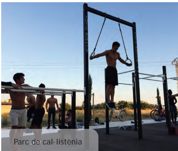
Parc de cal·listènia

Durant les passades Festes Majors fou al Parc Jove on es projectaren les pel·lícules del Cinema a la Fresca amb prop de 400 persones que van poder disfrutar d'una pantalla gegant, un magnífic so i no van haver de patir amb la pluja que va caure durant una de les projeccions. També va acollir una nova edició del Festival Picanya Rock que va reunir a centenars de joves per a disfrutar de la música en directe.