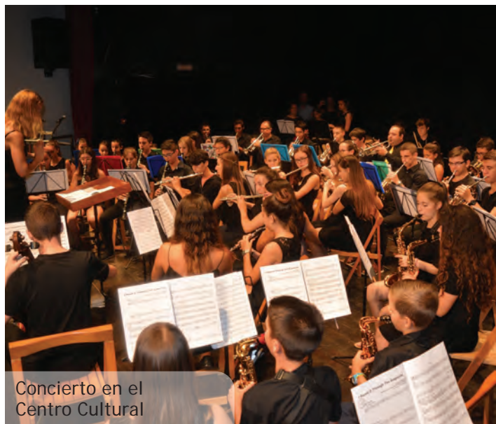
Concierto en el Centro Cultural