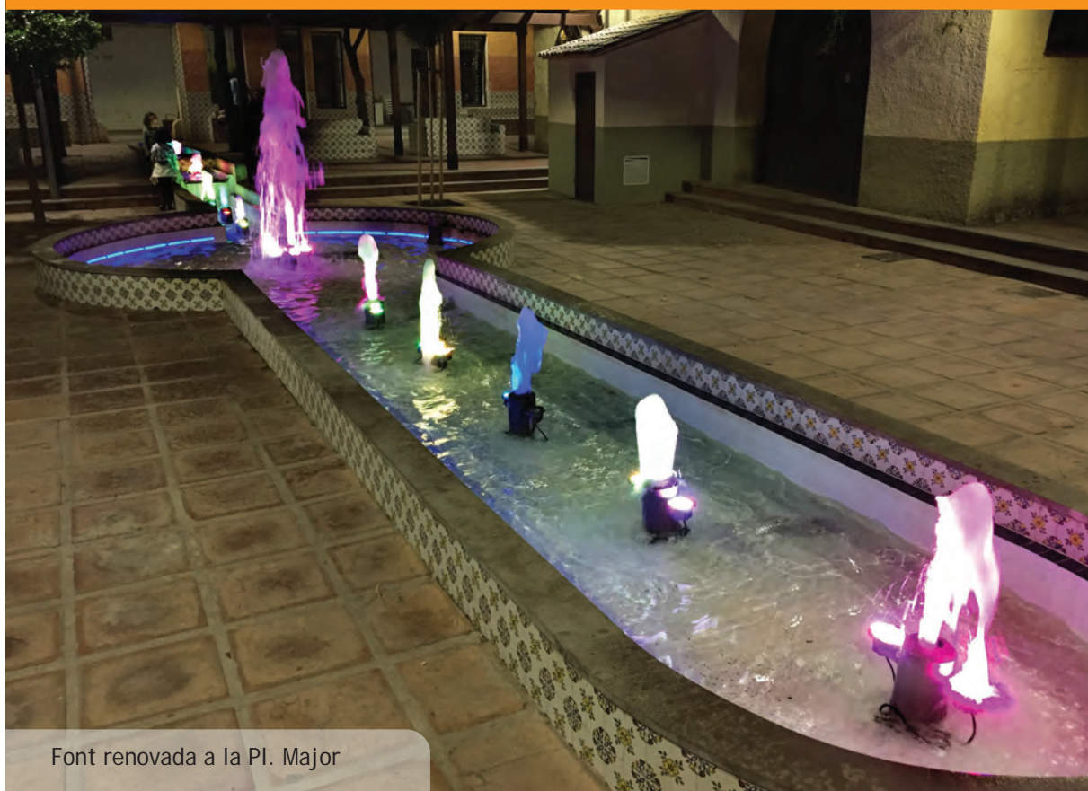
Font renovada a la Pl. Major