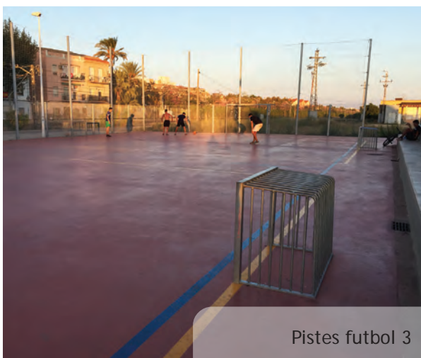
Pistes futbol 3