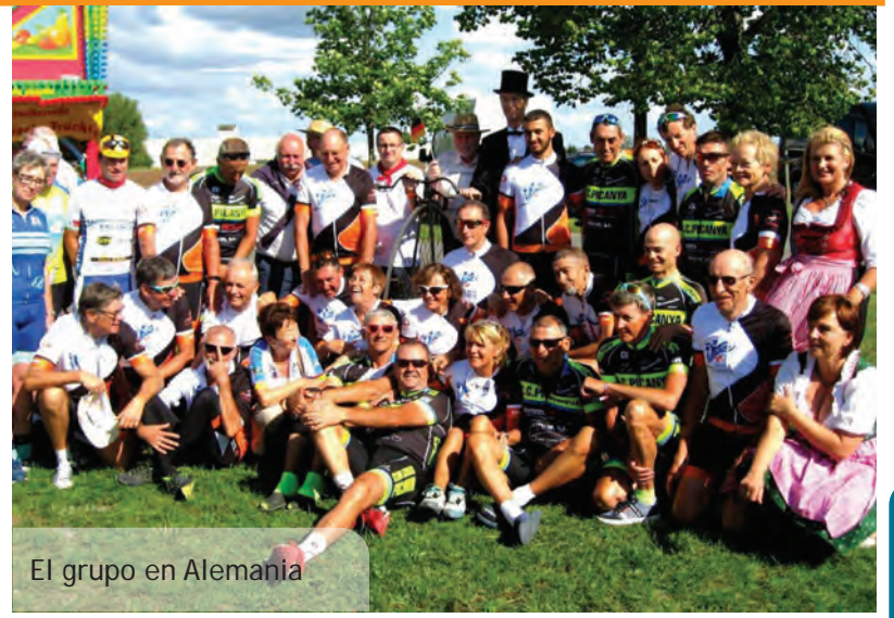
El grupo en Alemania