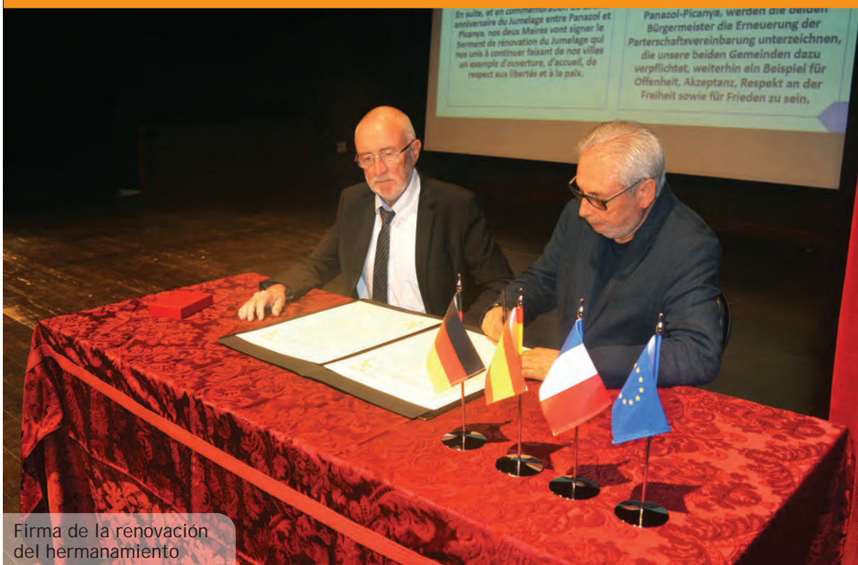
Firma de la renovación del hermanamiento