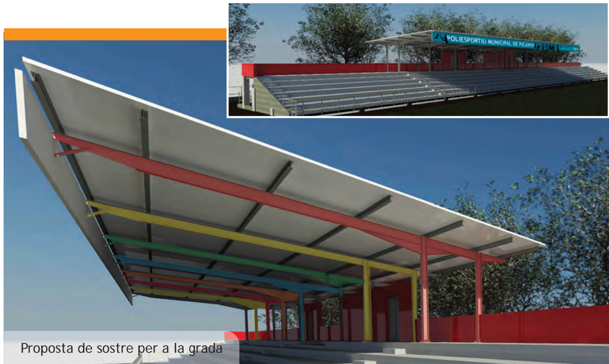
Proposta de sostre per a la grada