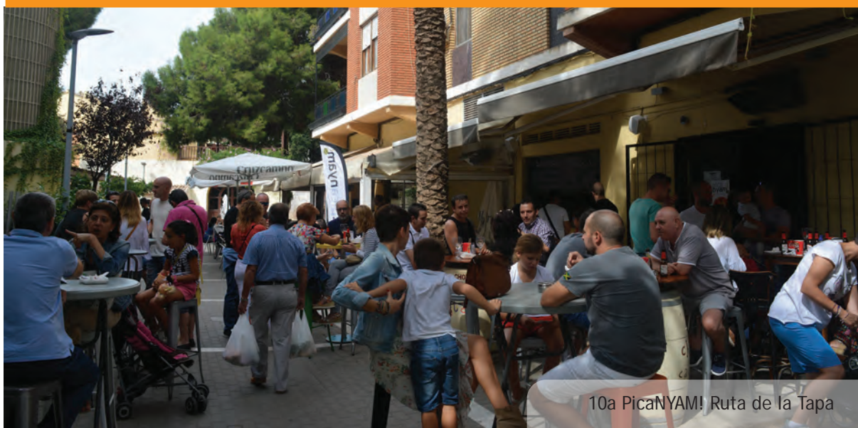
10a PicaNYAM! Ruta de la Tapa