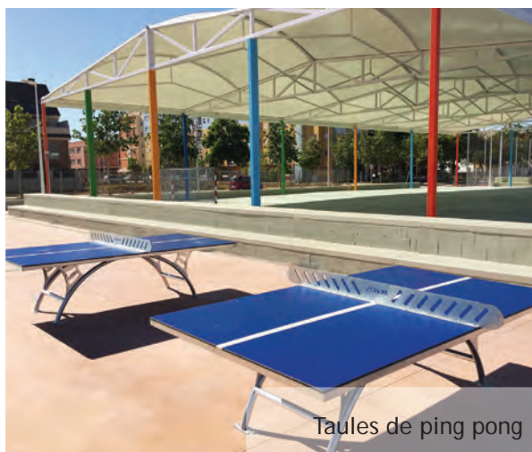
Taules de ping pong