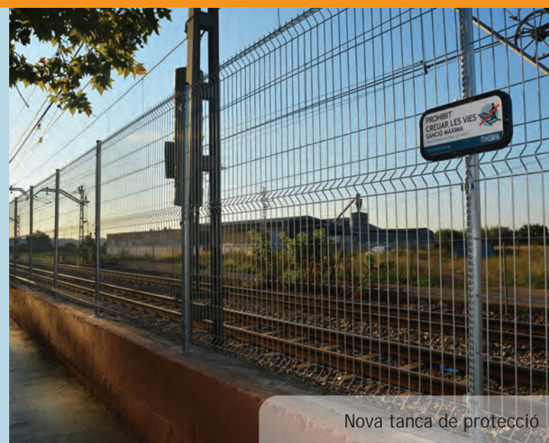
Nova tanca de protecció

A nadie se nos escapa que estamos viviendo un final del verano muy caluroso y si a esto sumamos que los meses de junio julio y agosto han sido más cálidos y húmedos de lo normal, el resultado es que las plagas de insectos encuentran las condiciones ideales para su reproducción. Por todo ello el Ayuntamiento de Picanya ha decidido alargar los tratamientos extraordinarios de verano durante unas semanas más. De esta manera a los habituales tratamientos contra mosquitos, cucarachas... se suman los tratamientos propios del estío. En todo caso, es muy importante que todas y todos nos mantengamos alerta a la hora de detectar y controlar los puntos de cría de los insectos. En casos como el del mosquito tigre, el 95% de las larvas se desarrollan a viviendas privadas.