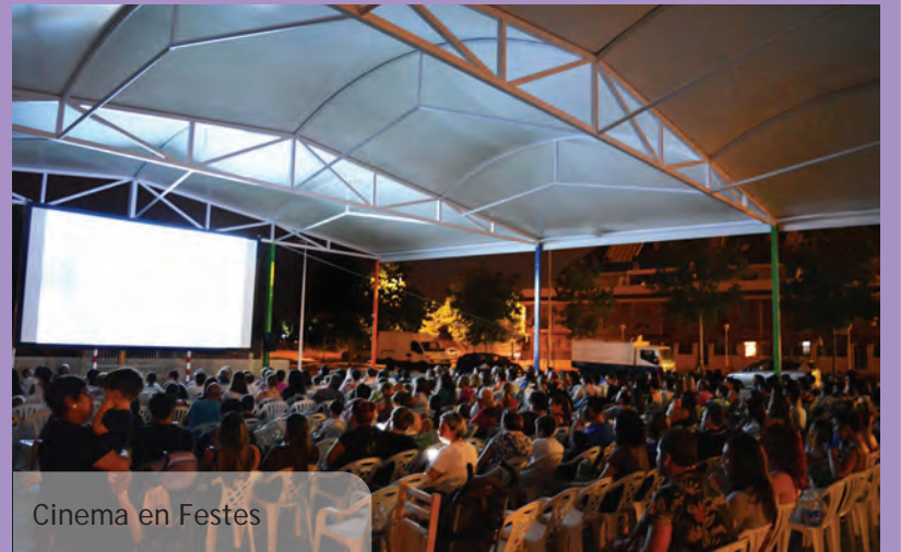
Cinema en Festes