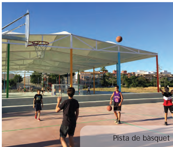
Pista de bàsquet