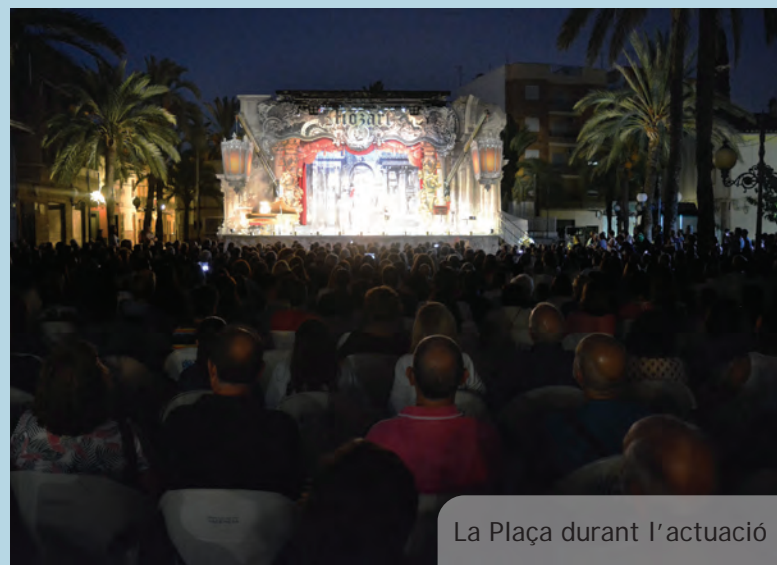
La Plaça durant l'actuació