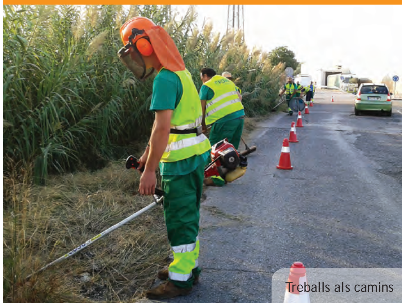
Treballs als camins