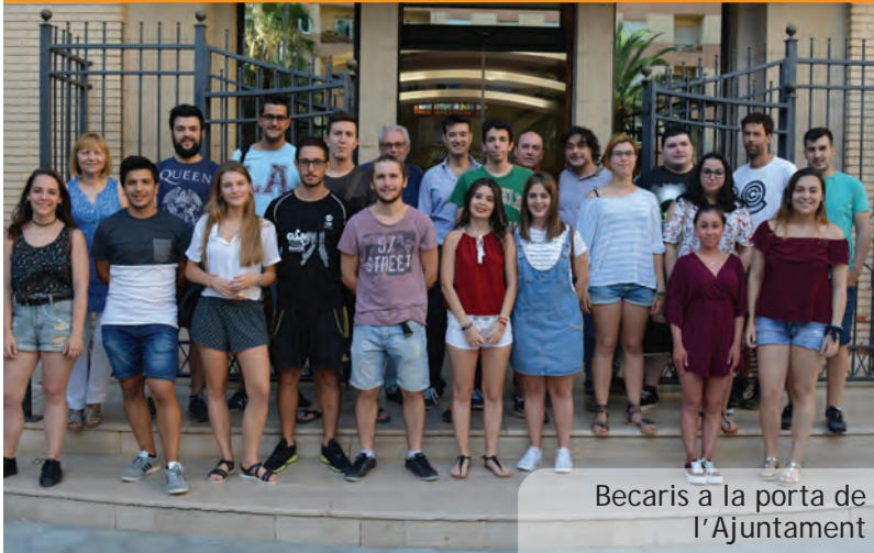
Beclaris a la porta de l'Ajuntament