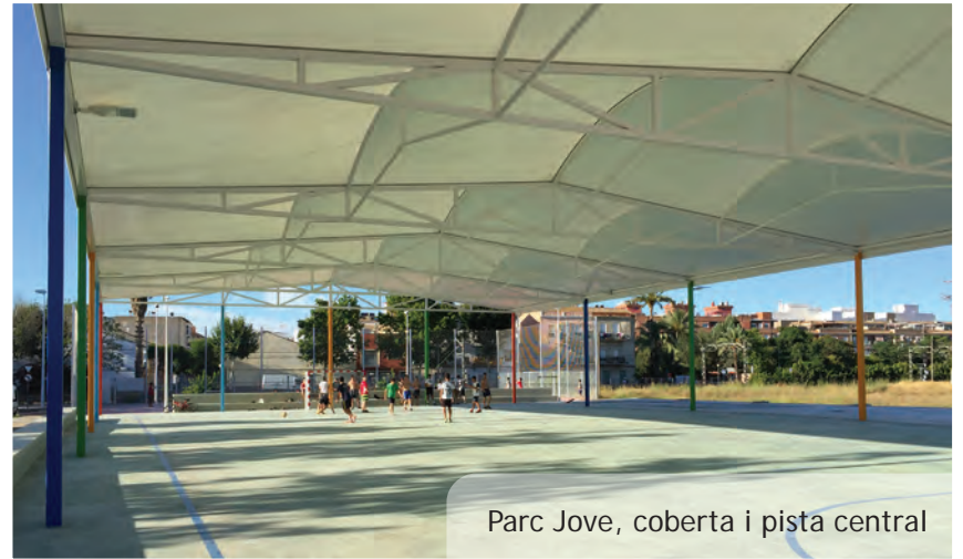
Parc Jove, coberta i pista central

La bona acollida viscuda este estiu ens parla de l'encert d'este nou concepte de parc, un parc adreçat a un públic jove, una instal·lació que ofereix diferents possibilitats d'oci actiu i que també és un espai per a la trobada, per a la conversa... un espai lliure, obert, diferent... pensant per al públic jove. Un públic que ja ha fet seu este espai i que l'ha convertit en un Parc Jove molt viu.