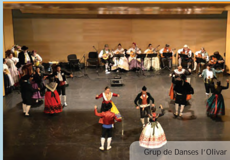
Grup de Danses l'Olivar

"Bastià i Bastiana" conta una història d'amor entre dos joves que transcorre en un humil llogaret de pastors. Cal destacar, com a curiositat, que Mozart fa servir la mateixa obertura de la Simfonia núm. 3 de Beethoven, la Heroica .