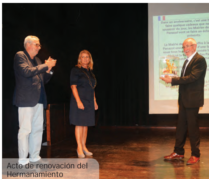
Acto de renovación del Hermanamiento