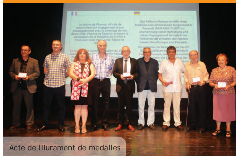
Acte de lliurament de medalles

Nota: El Ayuntamiento se reserva la posibilidad de modificar las condiciones de esta programación.