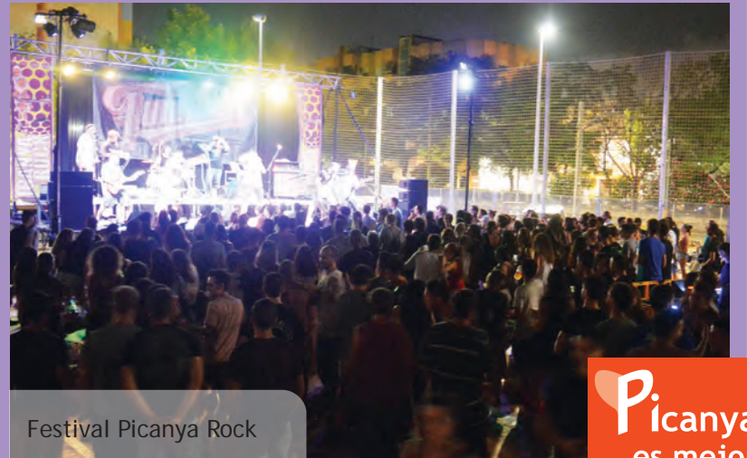
Festival Picanya Rock