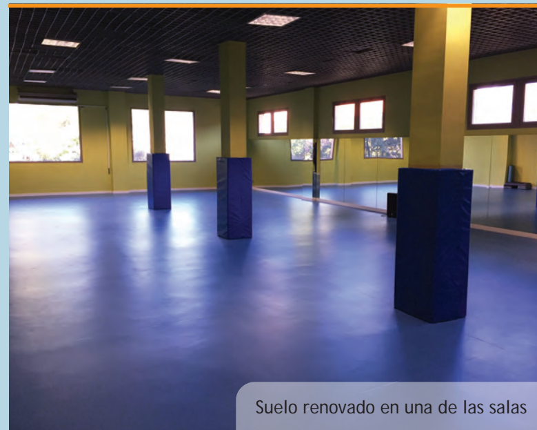
Suelo renovado en una de las salas

Esta tancapermetrà una jardineria de major port i densitat que millore l'estètica i l'aïllament acústic