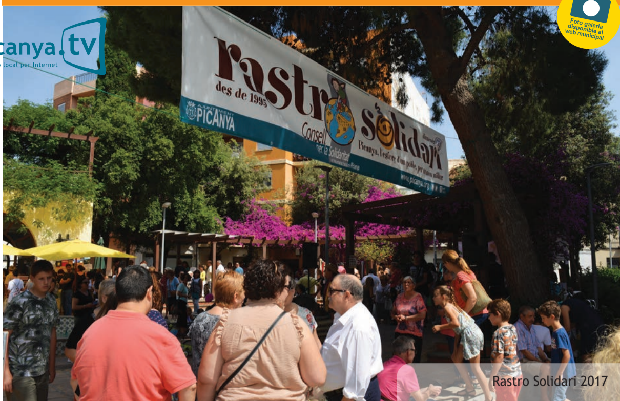
Rastro Solidari 2017