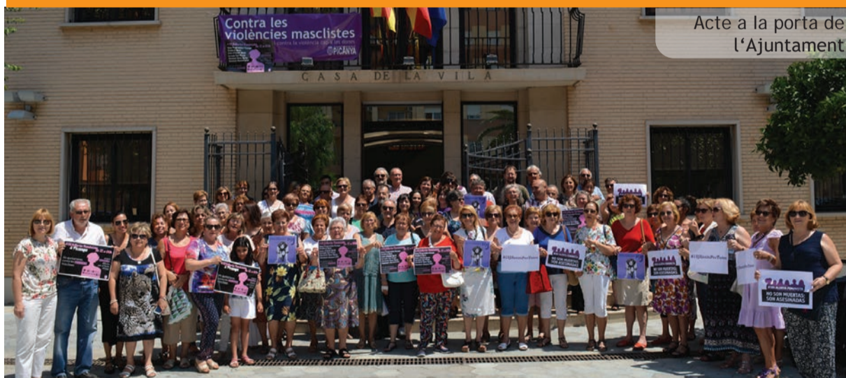
Acte a la porta de l'Ajuntament