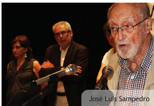
José Luis Sampedro

Tot i acompanyant al Maig Literari, com un acte central, com una bandera, Picanya lliura el premi Llig. Un premi, quasi més per al nostre poble que per als autors i autores que ens han fet l'honor d'acceptar-ho. Un altra excusa, finalment, per a xerrar de llibres, de lletres, de cultura amb persones que són protagonistes fonamentals d'este món. En este 2017 ha estat Antonio Muñoz Molina qui ens visità acompanyat per la seua dona Elvira Lindo (guanyadora l'any 2011), un autèntic plaer la trobada al Centre Cultural, un nom més que prestigi el premi Llig Picanya, que prestigi al poble de Picanya. El Maig Literari ja forma part de la història cultural i social del nostre poble. Així hem de celebrar-ho.