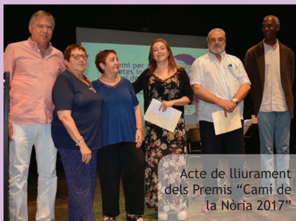
Acte de lliurament dels Premis "Camí de la Nòria 2017"