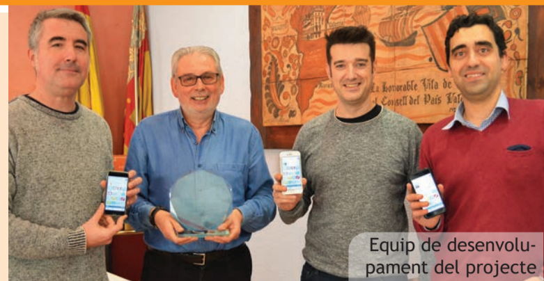
Equip de desenvolupament del projecte

Una vez contabilizados todos los votos, el resultado ha sido un nuevo primer premio para el bar "Pensat i Fet" que repite el éxito de años anteriores, con su tapa "Cordon bleu" (197 votos). En segunda posición quedó el "Hostal Nova Picanya", con su tapa "Carrillada con salsa" (149 votos). El tercer lugar ha sido para el "Celler de Peamflo", que se hace con su primer galardón con su tapa "Cracker de anchoa", gracias a los 138 votos obtenidos. Hay que destacar, que este último local fue el que más votos consiguió si sumamos las dos tapas ofrecidas, dado que obtuvo un global de 269 votos.