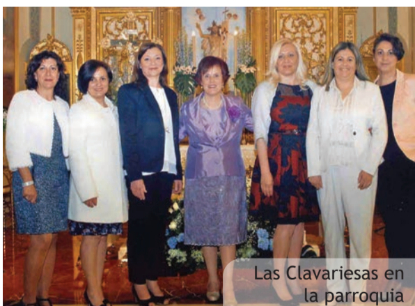
Las Clavariesas en la parroquia