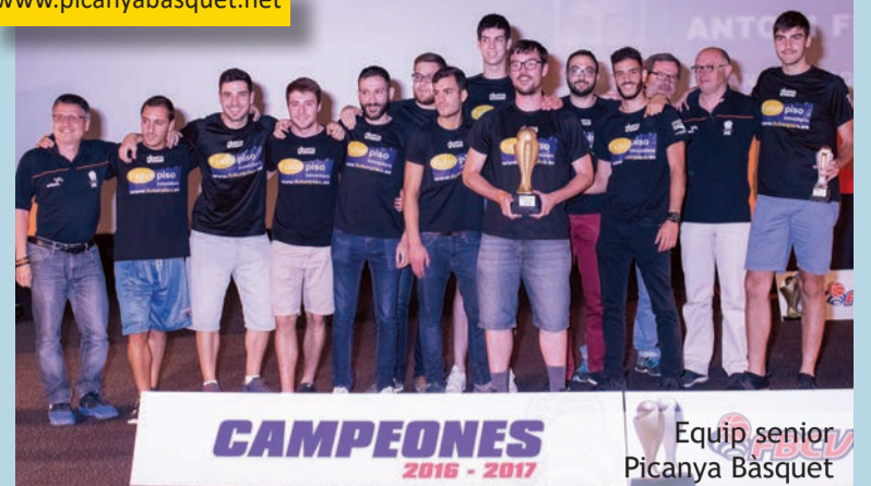
Equip senior Picanya Bàsquet