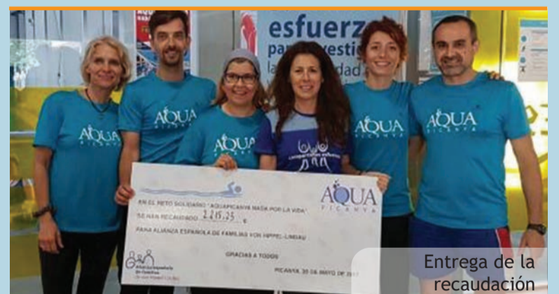
Entrega de la recaudación

De histórica se ha de calificar la temporada para los equipos juveniles del CD Juventud Picanya. Por una parte los chavales del Juvenil B se ha alzado con el título y con él el ascenso a categoría preferente después de una temporada espectacular. Por otra parte los jugadores del Juvenil A acabaron subcampeones de su grupo cosa que les dio derecho a luchar por el ascenso a categoría nacional. Desafortunadamente una derrota y un empate les dejaron sin este deseado ascenso.