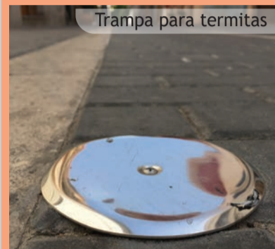
Trampa para termitas