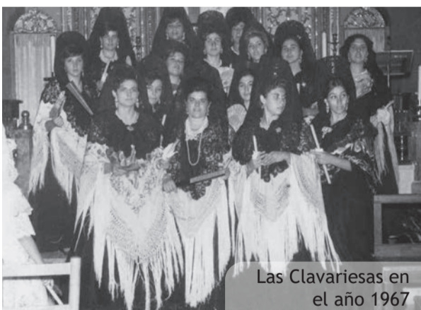
Las Clavariesas en el año 1967