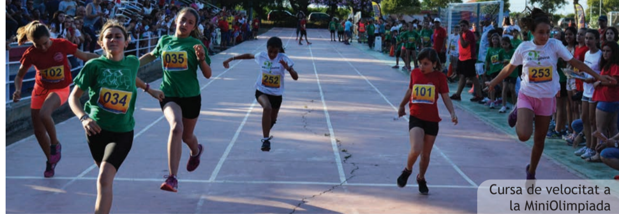
Cursa de velocitat a la MiniOlimpiada