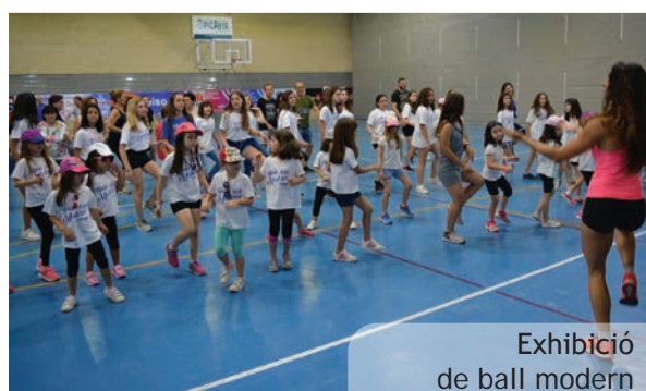
Exhibició de ball modern