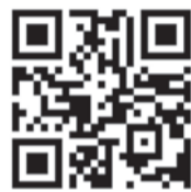
Descarrega APPicanya al teu mòbil

En esta edició 2017 el premi a la millor estratègia mòbil/APP pública fou per a l'aplicació municipal de l'Ajuntament de Picanya "APPicanya" de la qual el jurat va voler destacar el seu caràcter innovador, la seua qualitat tècnica i la quantitat de serveis que posa a l'abast de la ciutadania. A més el jurat va destacar el fet que fóra un Ajuntament d'un poble relativament menut com ara Picanya el que haguera sigut capaç de dissenyar, desenvolupar i posar en marxa una aplicació per a telefonia mòbil tan novedosa i avançada. De fet l'Ajuntament de Picanya fou la institució més menuda premiada en este congrés nacional on Ministeris, Governos autònoms i Diputacions, de tota Espanya, van copar la gran majoria de premis.