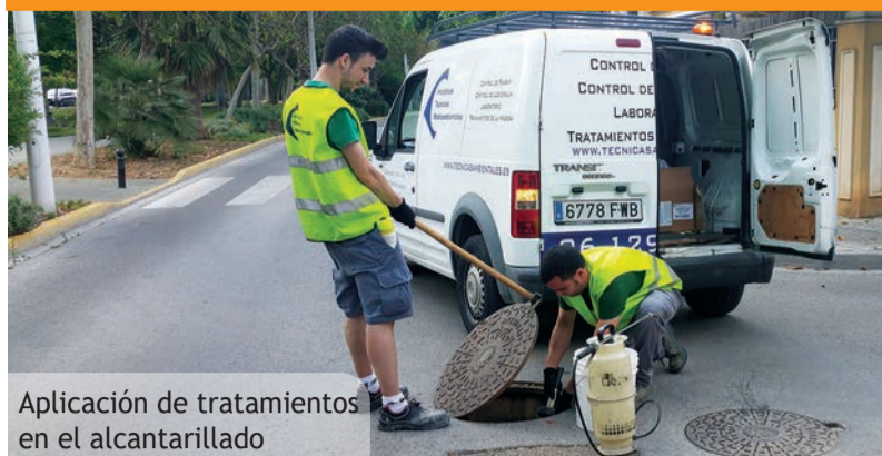
Aplicación de tratamientos en el alcantarillado