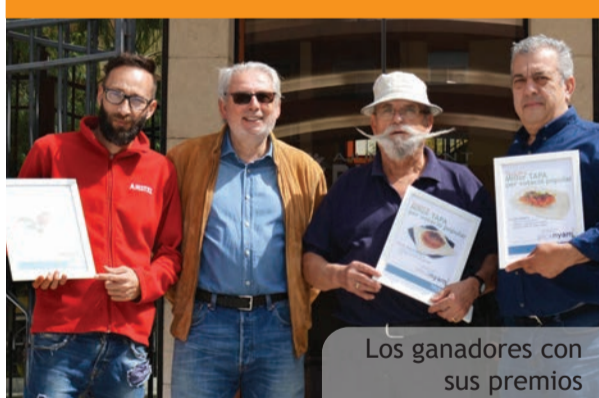
Los ganadores con sus premios