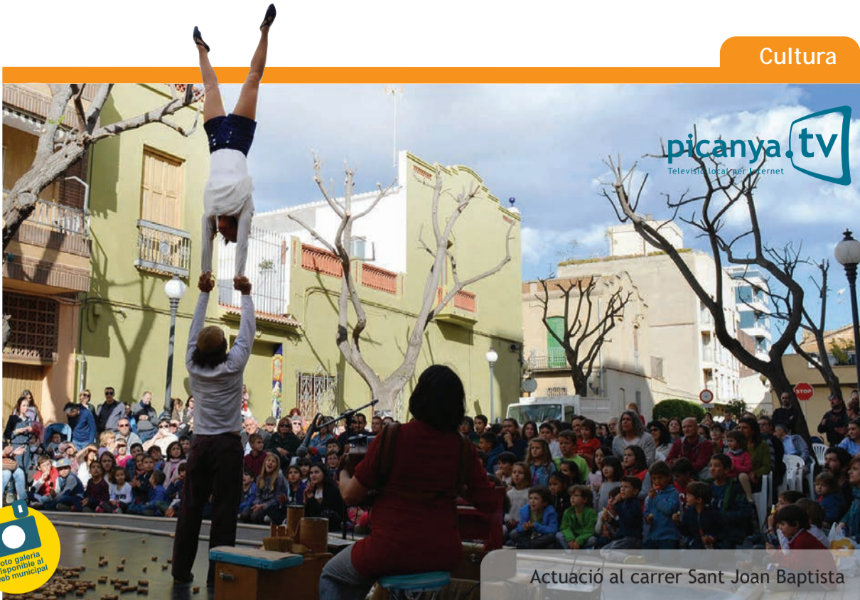
Actuació al carrer Sant Joan Baptista