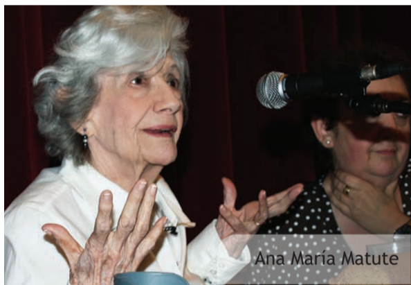
Ana María Matute