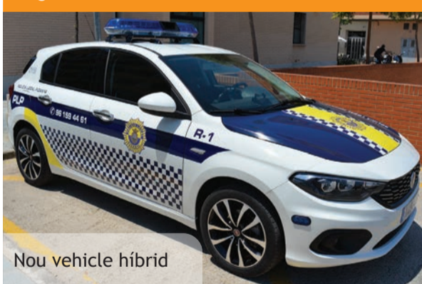
Nou vehicle híbrid