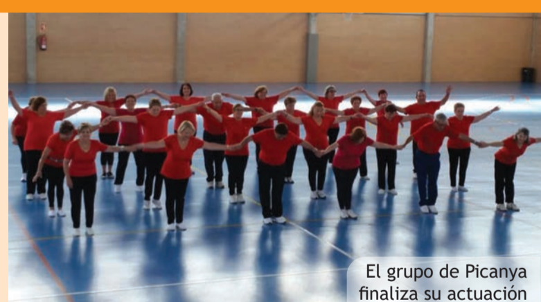
El grupo de Picanya finaliza su actuación