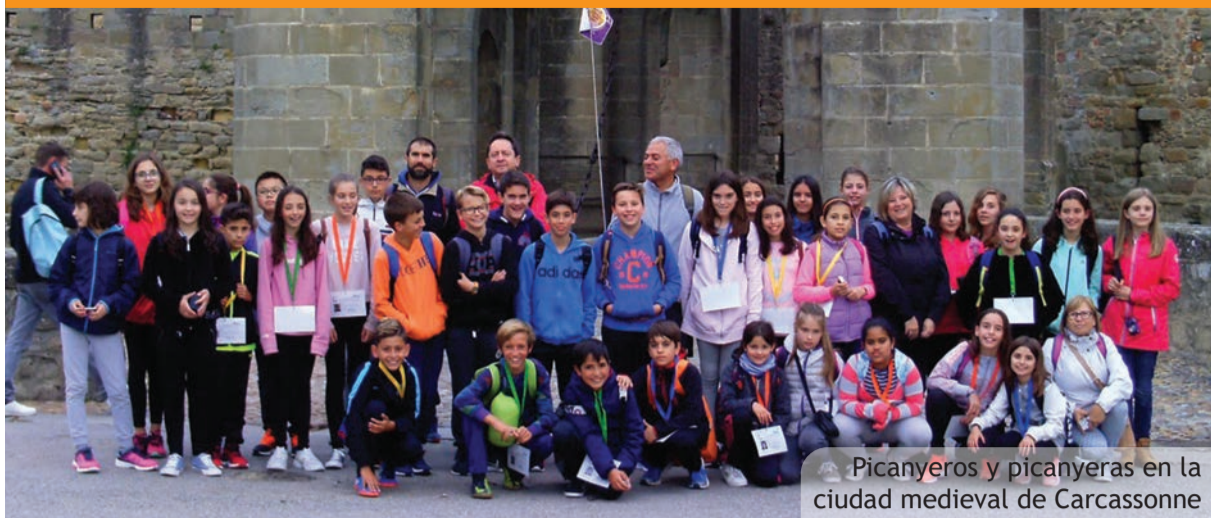
Picanyeros y picanyeras en la ciudad medieval de Carcassonne