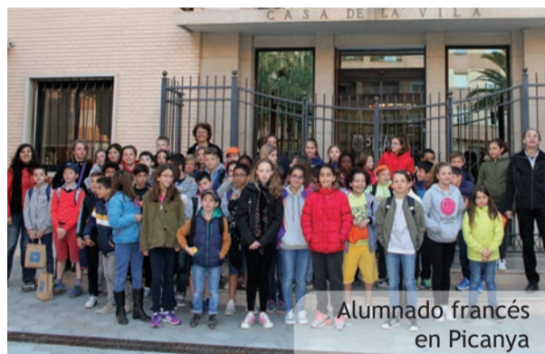
Alumnado francés en Picanya

En este 2017 el alumnado de Panazol visitó Picanya entre el 3 y el 9 de abril y picanyeros y picanyeras viajaron a Francia del 13 al 20 de mayo. Días intensos llenos de visitas y actividades que quedan ya en la memoria de nuestros niños y niñas.