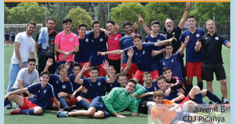
Juvenil B CDJ Picanya

Un nou èxit que, com els anteriors, estan basats en la determinant aposta del club pel treball de pedrera (pràcticament tots els jugadors del primer equip són veïns del nostre poble i tots estan formats en l'escola del club), un treball que els ha portat en tan sol cinc temporades des de la primera zonal fins a la primera divisió amb tres ascensos pràcticament consecutius.