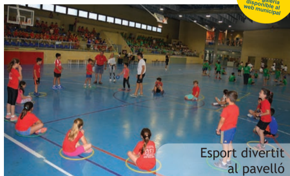
Esport divertit al pavelló

Enguany la MiniOlimpiada ha fet un pas endavant en la seua organització i ha incorporat la informatització de dades dels participants. D'esta manera s'han pogut fer dorsals per a cada atleta i llistats de participants de cada prova, cosa que ha facilitat i agilitzat els treballs de control de participació i resultats de les diferents disciplines al temps que donava un aspecte molt més "professional" als nostres xicotets atletes.