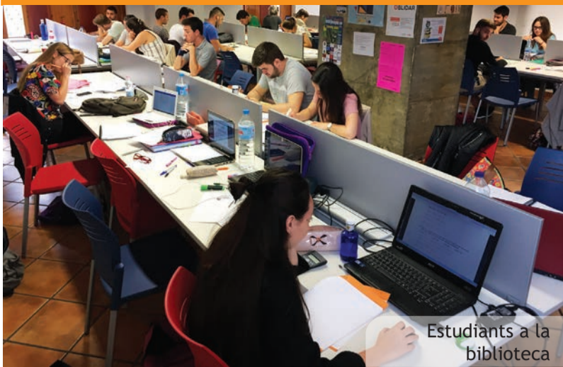
Estudiants a la biblioteca