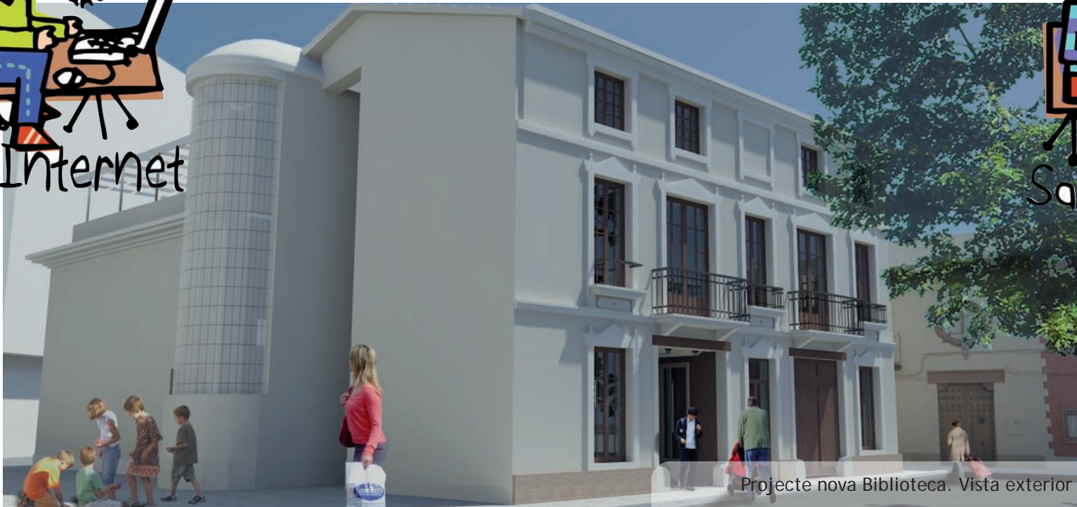
Projecte nova Biblioteca. Vista exterior