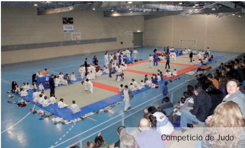
Competició de Judo