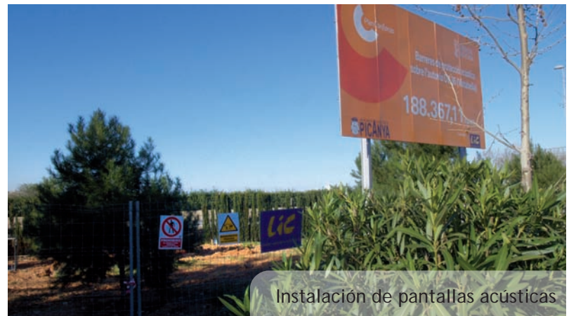
Instal·lació de pantalles acústiques

Finalmente, esta renovación se podrá cerrar con estas dos actuaciones que aniran en la misma línea que las realizadas anteriormente y que permitirán dotar a las dos zonas de mayor comoditat i seguretat per a menuts i menudes.