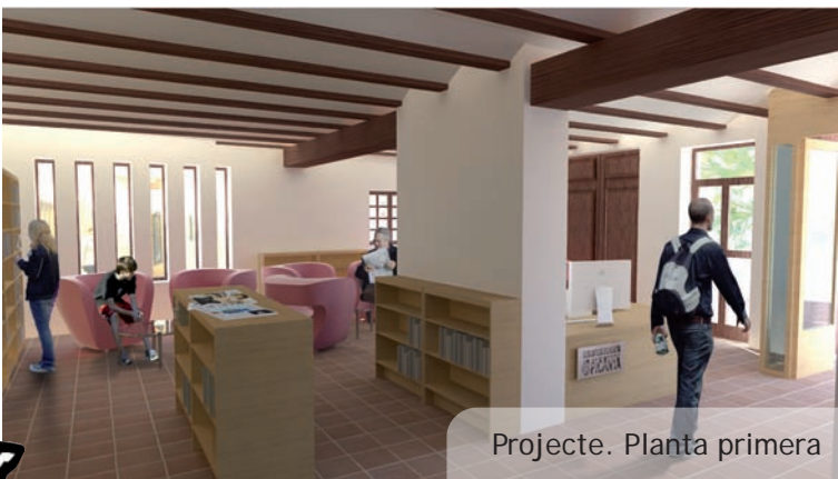
Projecte. Planta primera