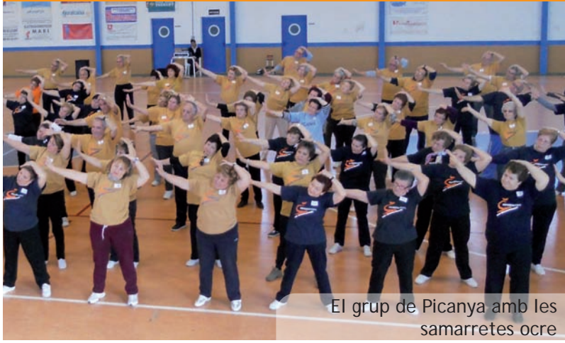
El grup de Picanya amb les samarretes ocre