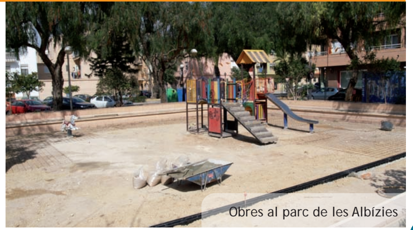
Obres al parc de les Albízie