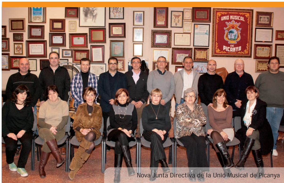
Nova Junta Directiva de la Unió Musical de Picanya

Impressió: Gràfiques Vimar SL Dipòsit legal: V-257-1992