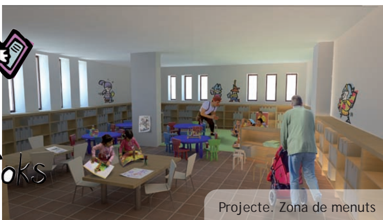
Projecte. Zona de menuts