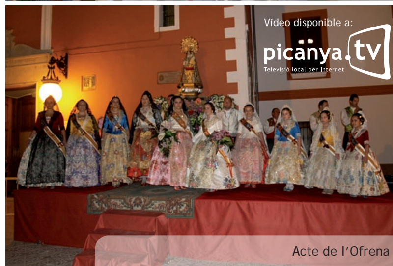
Video disponible a: