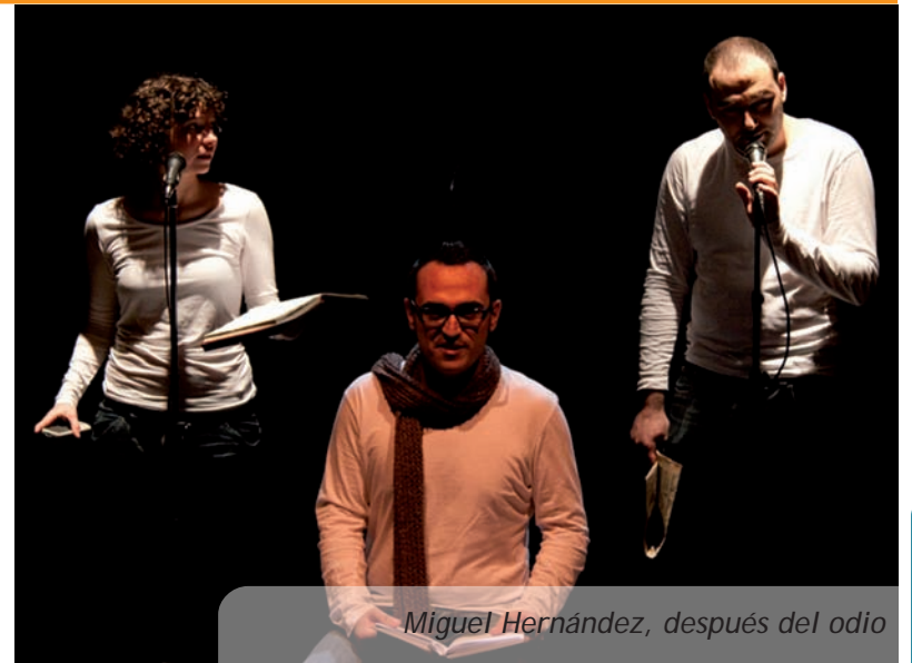
Miguel Hernández, después del odio