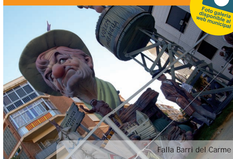
Falla Barri del Carme

El Ayuntamiento de Picanya ha realizado los trámites necesarios para obtener la subvención económica para financiar 40 plazas públicas de atención específica a personas mayores en el Centro de día ubicado en las viviendas adaptadas para mayores de Picanya, acogiendo a la Orden 40/2010, de 27 de diciembre de la Conselleria de Bienestar Social por la que se regulan y convocan ayudas en materia de Servicios Sociales para el ejercicio 2011.