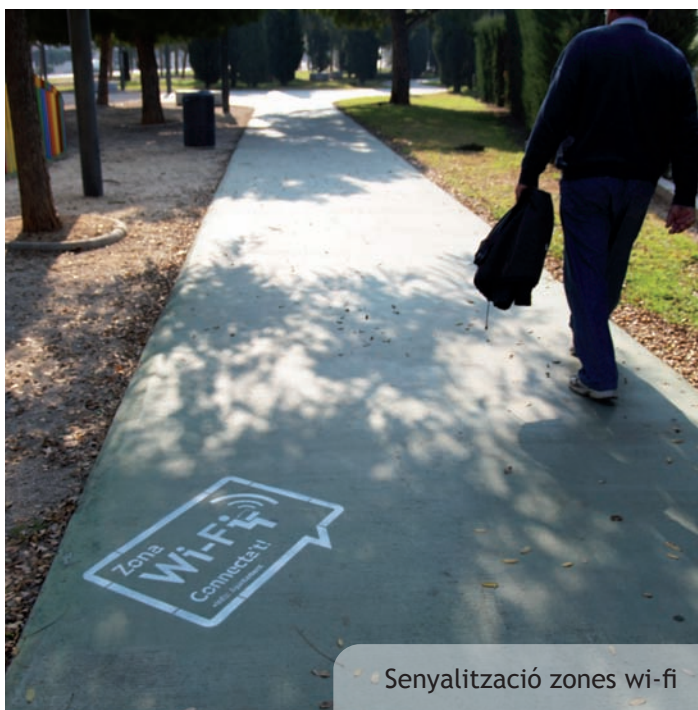
Senyalització zones wi-fi

L'acceptació entre la nostra població (especialment entre la gent jove) de la xarxa de wi-fi pública ha animat l'Ajuntament a ampliar el nombre de punts de connexió i en eixe sentit està previst l'establiment d'un nou punt d'accés al parc de les Albíziez.