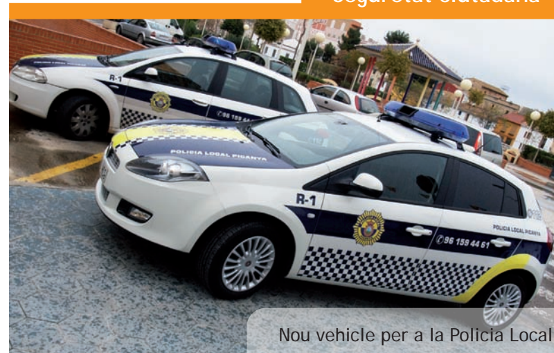
Nou vehicle per a la Policia Local