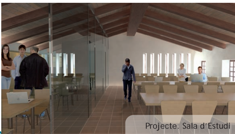
Projecte. Sala d'Estudi