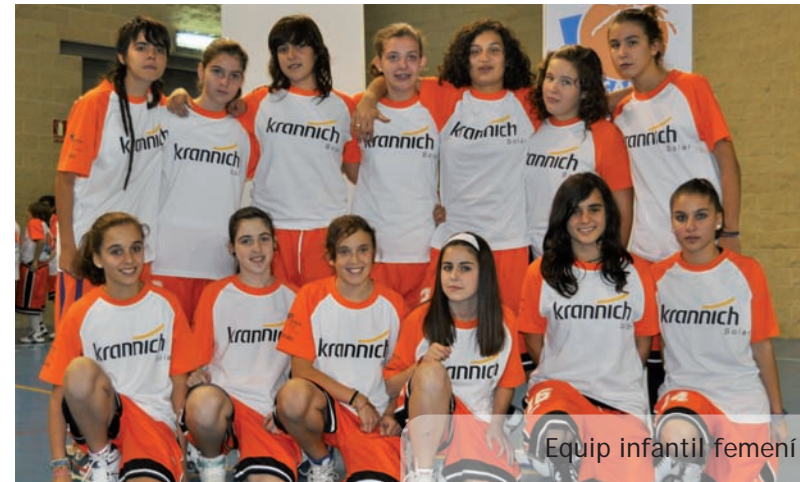
Equip infantil femení