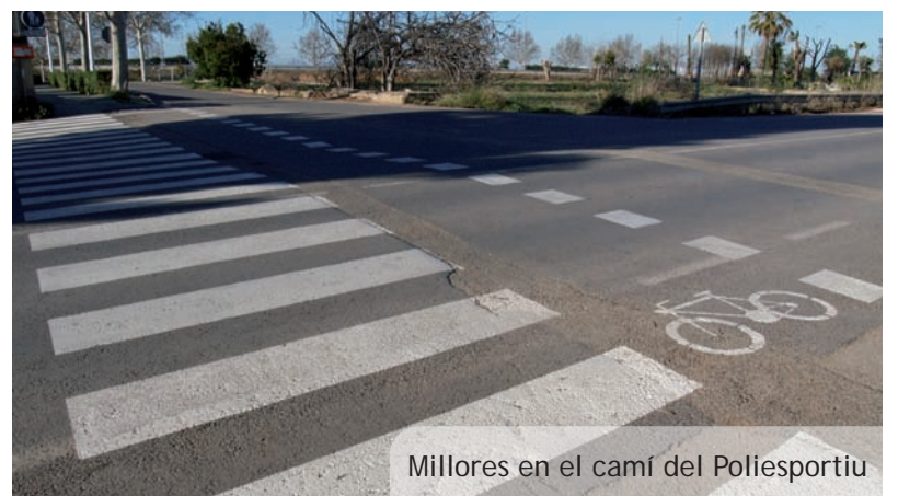
Millores en el camí del Poliesportiu

lla. Ya se han iniciado las obras de instalación de las pantallas acústicas que aislarán la carretera de la zona habitada.