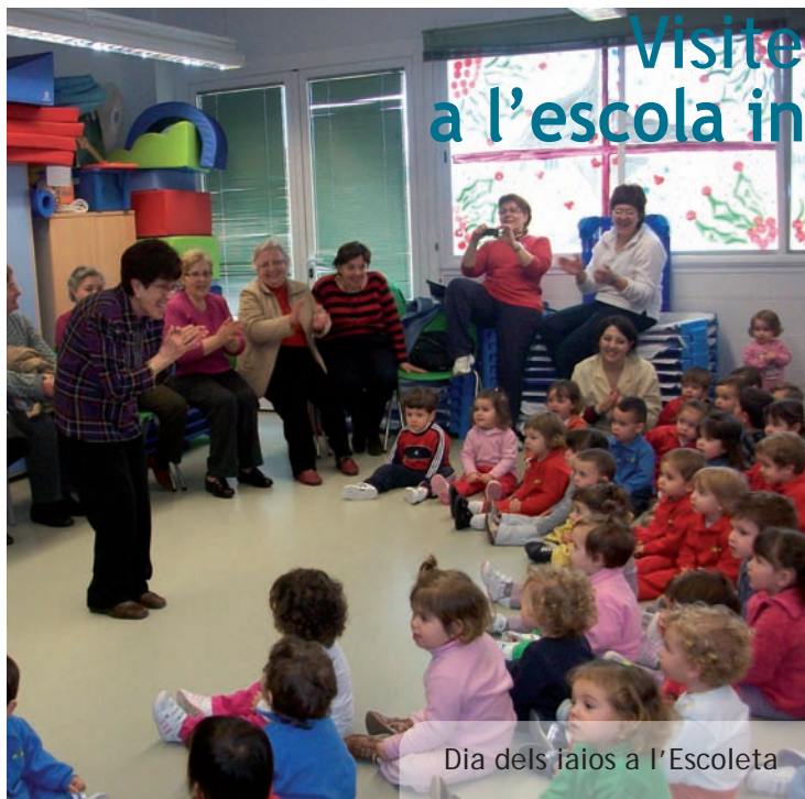
Dia dels iaies a l'Escoleta

El passat dissabte 5 de març l'escola infantil La Mandarina de Picanya va celebrar una jornada de portes obertes. L'objectiu era donar a conèixer a la població les instal·lacions de l'escoleta (l'única homologada per la Conselleria de la GV al nostre municipi) i facilitar als pares dels futurs alumnes tota la informació sobre el procés de matriculació.